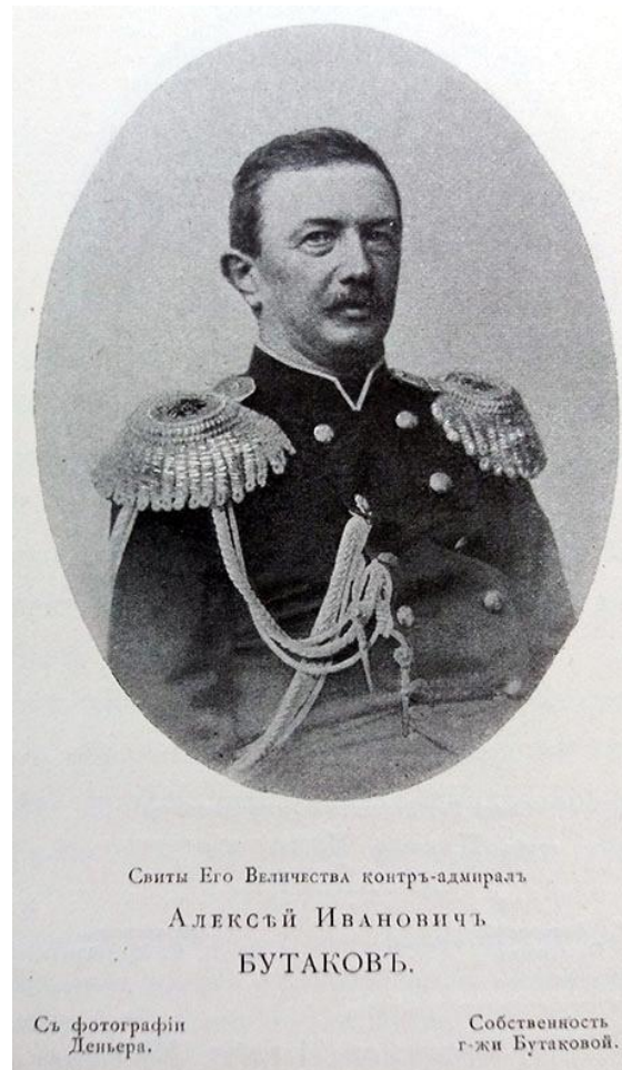
Рис. 2 Алексей Иванович Бутаков

Летом 1849 г. капитан-лейтенант Бутаков, со шхуны «Константин», изучил восточный и вторично южный берег Аральского моря, а прапорщик Поспелов со шхуны «Николай», - Восточный берег моря и пересохшие русла устья р. Кувандарьи. В том же году, при осмотре полуострова Куланды, открыты там прииски каменного угля, для исследования которых генерал-лейтенант Обручев, в январе 1850 г., ходатайствовал об отправлении на Аральское море от горного ведомства опытного штейгера и нескольких чернорабочих (Рис. 2).