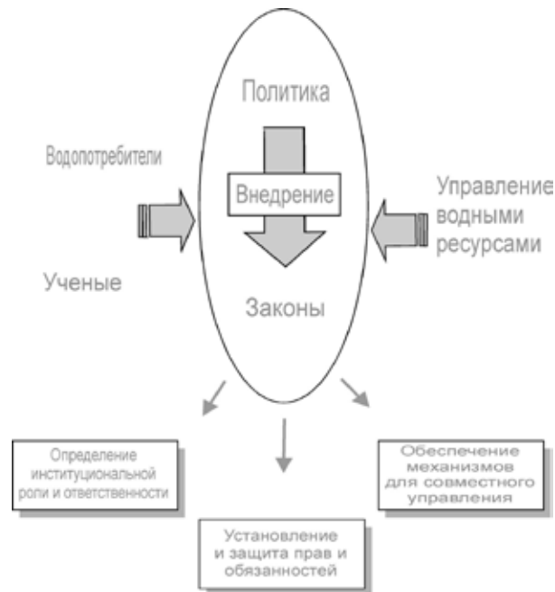
Рисунок 5: Задачи законодательства.