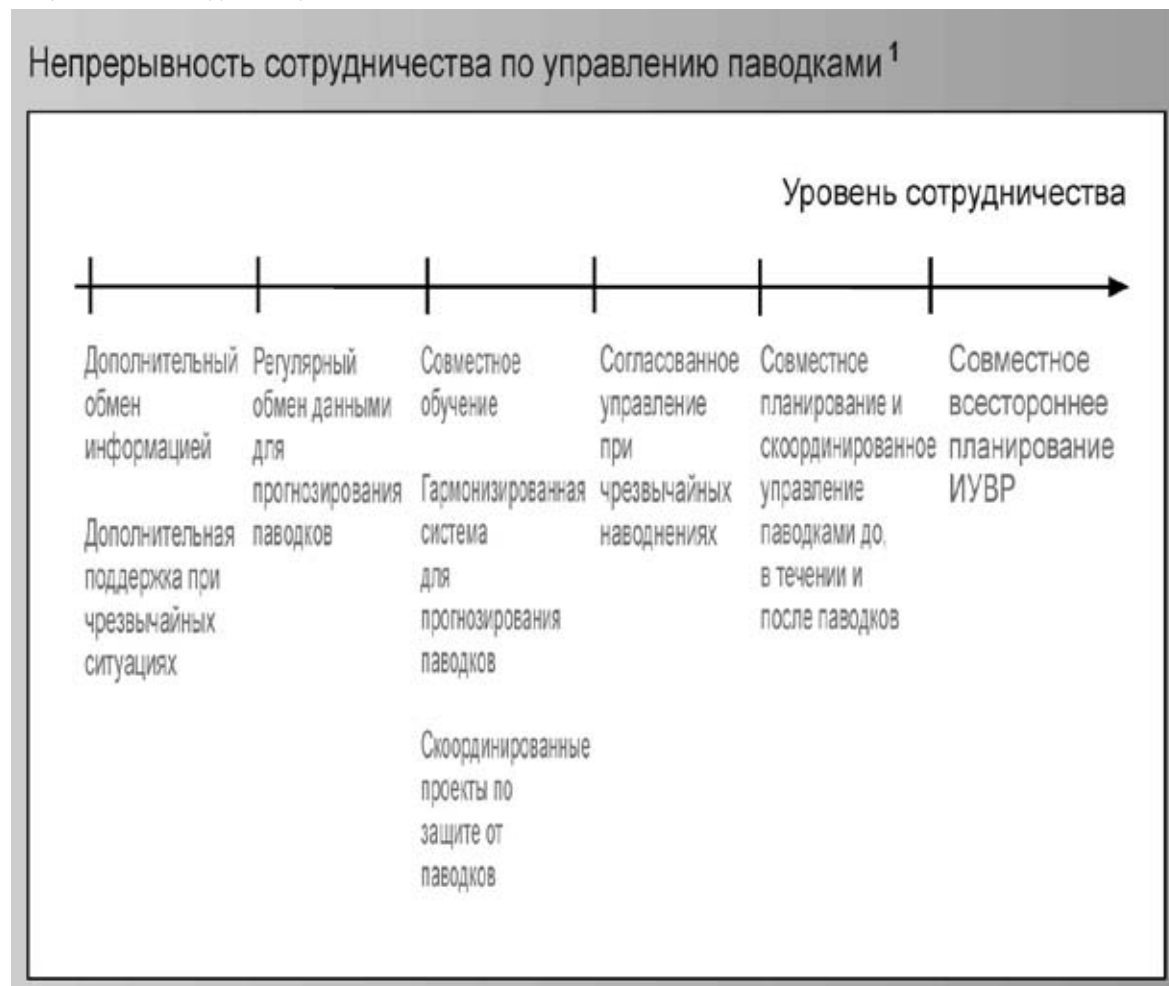
Рисунок 2: Континуум сотрудничества в области борьбы с наводнениями.