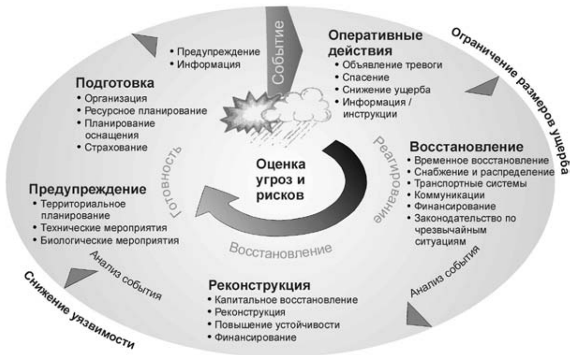
Рисунок 1: Цикл комплексного управления рисками.