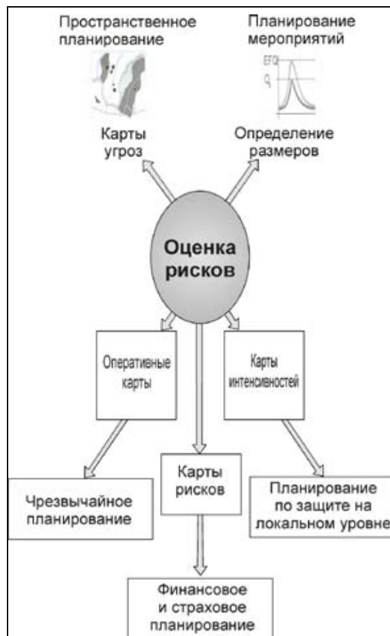
Рисунок 3: Оценка опасности: основные виды карт деятельности, связанной с опасностью.