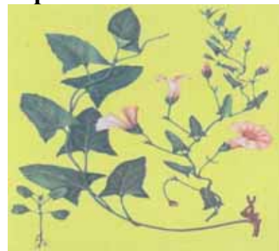
Сорные растения и борьба с ними Ташкент-2007

26) Информационная база для оценки и анализа сельскохозяйственной деятельности в фермерском хозяйстве.