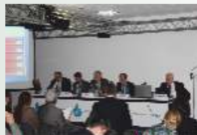
Участники 6-го ВВФ, Марсель, Франция, 2012 г.

Большое внимание МКВК уделяет привлечению доноров для развития региональных проектов, что оказывает большое влияние на специалистов наших стран в части усиления понимания общих позиций и выработки совместных подходов к решению спорных и взаимосвязанных вопросов.