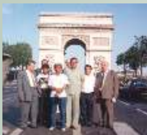
Делегация МКВК в Париже, 1994 г.

Делегации МКВК принимали активное участие в работе Всемирных водных форумов: 2-го в Нидерландах (2000 год), 3-го в Японии (2003 год), 4-го Ф в Мексике (2006 год), 5-го в Турции (2009 год), 6-го во Франции (2012 год).