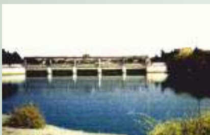
Головное сооружение межгосударственного канала «Дустлик»

Большое значение в управлении водными ресурсами бассейна имеет достоверность гидрологических прогнозов. Поэтому МКВК постоянно продвигает инициативы для усиления взаимодействия органов водного хозяйства и гидрометслужб по уточнению стока рек Сырдарья и Амударья и повышению степени достоверности гидрометеорологических прогнозов.