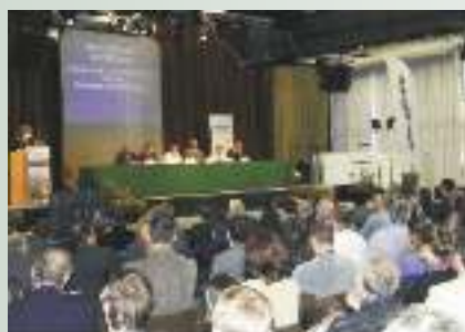
Генеральная Ассамблея МАВР, в Мегеве, Франция, 2011 г.

Совместно с IHE UNESCO завершается работа по созданию модели перспективного развития водного хозяйства региона, позволяющая учесть различные приоритеты каждого государства, и на основе этого наметить для всех стран рубежи по водосбережению и другие меры, с тем, чтобы подготовиться к нарастающему водному дефициту.