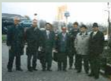
Делегация МКВК на 2-м ВВФ, Гаага, 2000 г.