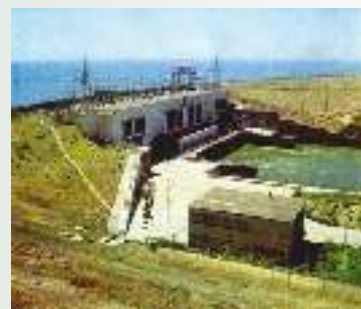
Гидросооружение на Чардаринском водохранилище

Немалое внимание уделяется вопросу внедрения автоматизации на водохозяйственных системах. При финансовой поддержке международных организаций созданы и сданы в эксплуатацию автоматизированные системы управления и контроля головными сооружениями канала «Дустлик» (CIDA), Верхне-Чирчикского водного узла (USAID), Учкурганского гидроузла и всего комплекса головных сооружений БВО «Сырдарья» в Ферганской долине (SDC). Завершено строительство аналогичных систем на трех пилотных каналах в Узбекистане, Кыргызстане и Таджикистане (SDC).