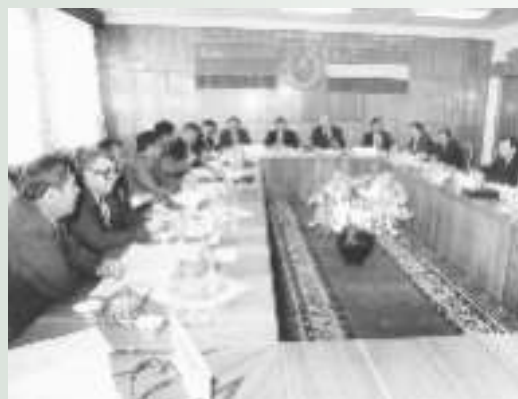
Шестое заседание МКВК, Нукус, Октябрь 1993 г.