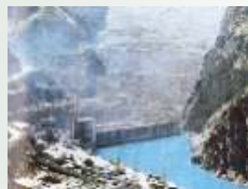
Плотина Нурекской ГЭС