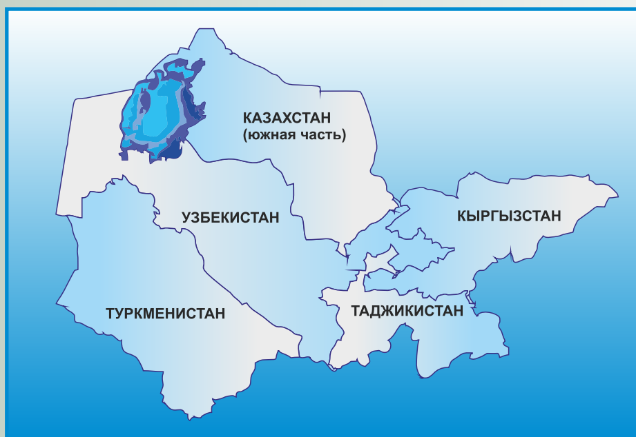
Бассейн Аральского моря

Расположенный в самом сердце Центральной Азии, бассейн Аральского моря является одним из центров зарождения цивилизации. Как известно из мировой истории цивилизация всегда зарождалась возле воды, и ее развитие зависело и зависит от использования водных ресурсов. Источником водных ресурсов в бассейне Арала являются две главные реки – Амударья и Сырдарья, которые берут начало в горах Тянь-Шаня и Памира и протекают по территории Афганистана, Таджикистана, Кыргызстана, Туркменистана, Узбекистана и Казахстана. Вместе со своими притоками – реками Вахш, Пяндж, Сурхандарья, Кафирниган, Зерафшан, Нарын, Чирчик, Карадарья и другими – две главные реки образуют сложный водохозяйственный комплекс бассейна Аральского моря.