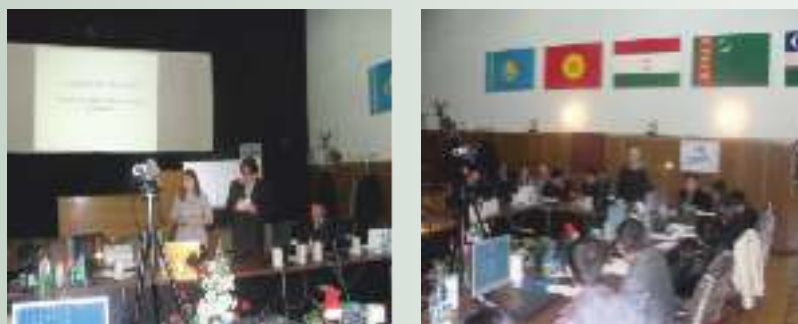
Занятия в Тренинговом центре

Для повышения квалификации работников водного хозяйства с 2000 года МКБК организованы региональные учебные курсы. Региональный тренинговый центр осуществляет повышение квалификации работников водного хозяйства высшего и среднего звена государств-учредителей путем организации обучающих семинаров по вопросам ИУВР, национального и международного водного права, совершенного орошаемого земледелия, природопользования и др. с обеспечением равного представительства стран региона, готовит и издает необходимую учебно-методическую литературу. С целью повышения эффективности тренинга для охвата большого количества местных специалистов, созданы субрегиональные филиалы в Оше, Ургенче, Алматы, Бишкеке, Андижане, Фергане, Ходженте, Акбарбаде.