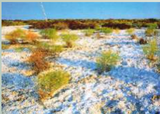
Высохшее дно Аральского моря

С 1991 года в Центральной Азии происходят изменения в политико-экономической ситуации. Вновь образованные пять независимых государств начали свой путь к рыночной экономике, определив свои национальные интересы социально-экономического развития проблемы вокруг воды в бассейне Аральского моря с каждым годом все более обостряются. Особое место здесь занимает кризис самого Аральского моря, включая экологические и социально-экономические последствия процесса высыхания моря, ухудшение состояния водных ресурсов региона, а также вопросы многоцелевого использования воды. Негативные предпосылки в сфере водопользования в значительной мере влияют на устойчивое развитие экономик стран Центральной Азии.