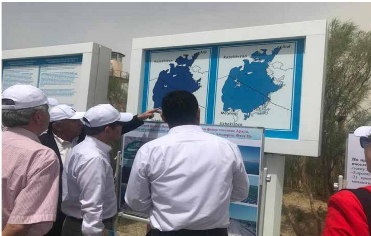
Муйнак: «Кладбище погибших кораблей». 6 июня 2018 г.