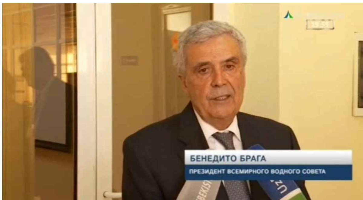
В стенах ТИИИМСХ Президент Брага дал интервью телеканалам Узбекистана

Во время встречи с руководством и сотрудниками Министерства водного хозяйства Президент Брага отметил, что Всемирный водный совет с воодушевлением принял новость о решении Правительства Узбекистана реформировать водное хозяйство страны. «Мы высоко ценим усилия Узбекистана по рациональному и эффективному использованию водных ресурсов. Сам факт создания Министерства водного хозяйства говорит о важности этих усилий и прагматичном подходе к ее решению в Узбекистане. Приглашаю Минводхоз Республики Узбекистан принять участие в выборах в состав Правления ВВС на новый цикл. Ваш опыт в вопросах внедрения водосберегающих технологий будет очень ценным вкладом в деятельность ВВС» - сказал Бенедито Брага.