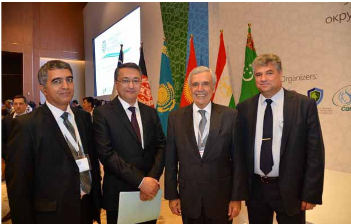
Министр водного хозяйства Хамраев Ш.Р., Председатель Государственного комитета по экологии и охране окружающей среды Кучкаров Б., Президент Всемирного водного совета Брага Б., Директор Агентства ГЭФ МФСА Соколов В.И.