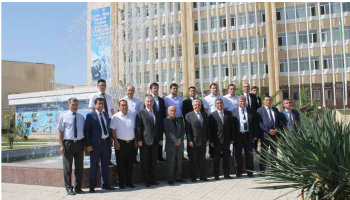
Президент Брага с руководством и сотрудниками Минводхоза и ТИИМСХ, 5 июня 2018 г.