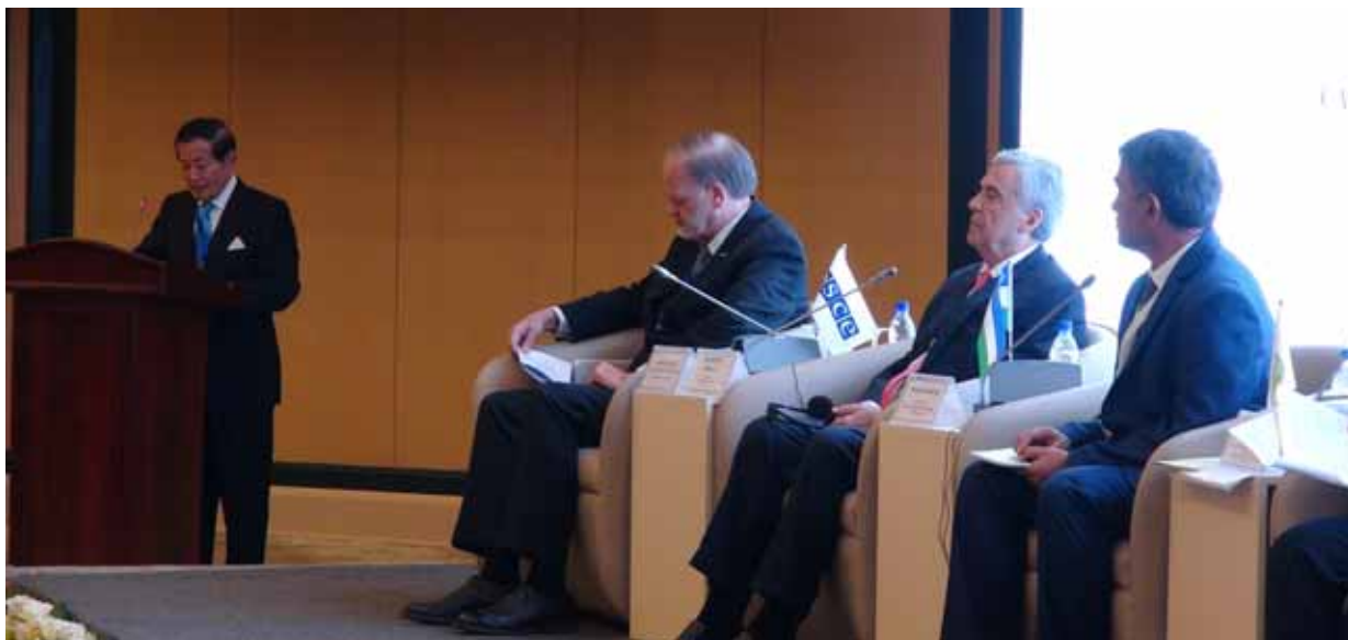
Пленарное заседание: выступает Юкио Такасу, Специальный советник Генерального секретаря ООН по вопросам человеческой безопасности, сидят: Джон МакГрегор Координатор проектов ОБСЕ в Узбекистане, Президент Всемирного водного совета Бенедито Брага, Министр водного хозяйства Узбекистана Шавкат Хамраев. 8 июня 2018 г.