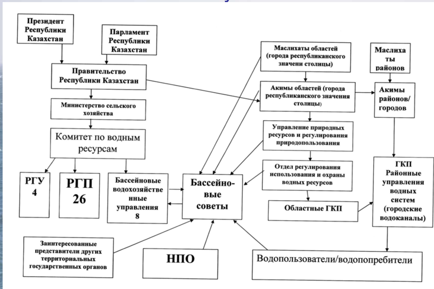
Схема управления и регулирования водных отношений в Республике Казахстан