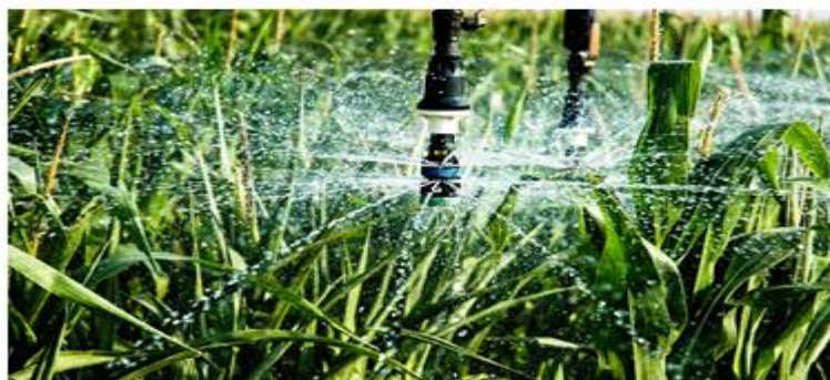
Рисунок 2. - Технология точного орошения (по данным сайта Trimble [14])

Технологии точного орошения оптимизируют на поле способы вдоподачи сельхозкультурам, обеспечивают учет конфигурации поля, потребности в поливе различных участков одного поля и его топографии, а также прочей специфики поливаемых полей, что способствует рационализации водопотребления и экономии водных ресурсов.