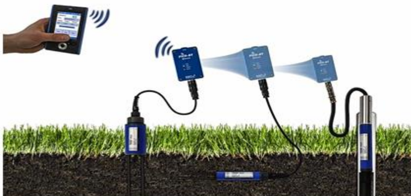
Рисунок 1. –Контроль процедур полива (по данным сайта CropX [11])

Результаты и обсуждение. По оценкам экспертов к 2050 г. население Земли возрастет до 9 миллиардов человек, увеличившись более чем на 30%, что обуславливает нарастающую жесткость требований к обеспечению продовольственной безопасности планеты. В настоящее время до 40% общего объема мирового производства продовольствия гарантирует орошаемое земледелие. В свете возрастающей конкуренции на водопотребление с другими секторами развивающейся экономики и необратимости требований к экологизации и устойчивости агропроизводства приоритетными направлениями эволюции систем управления мелиоративным режимом агроэкосистем настоящего периода признаются технологии: контроля процедур полива; точного орошения; автоматизации процессов орошения [1,5-7,8, 21].