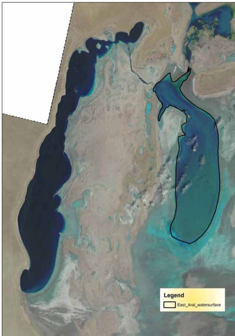
Рис.1 Снимок Аральское море за июнь

В НИЦ МКВК сделан мониторинг по Аральскому морю и Приаралью с использованием спутниковых снимков Landsat 8. Снимки были сняты 25 марта, 26 апрель, 28 мая и 13 июня 2015 года для определения площади ветландов и открытой водной поверхности на территории Приаралья и Аральскому морю.