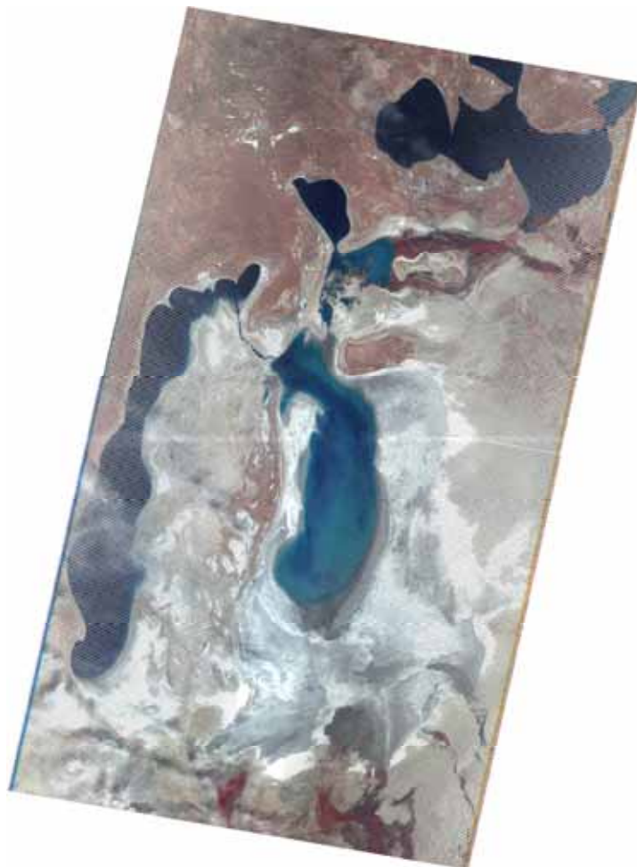
Рис. 1 Аральское море. Июнь – 2013

В НИЦ МКВК сделан мониторинг по Аральскому морю и Приаралью с использованием спутниковых снимков (Landsat - ETM). Определены площади растительности и открытой водной поверхности на территории Аральского моря и Приаралья за июнь 2013 года