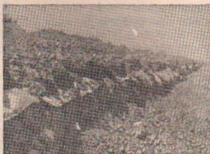
2 Канал ПР-1-4-1. Пленочное покрытие повреждено при очистке канала экскаватором

нок (полиэтилен стабилизированный и нестабилизированный, полихлорвинил), уложенные без засыпки, разрушались в течение одного вегетационного периода, и поэтому от них пришлось отказаться уже в стадии опытов.