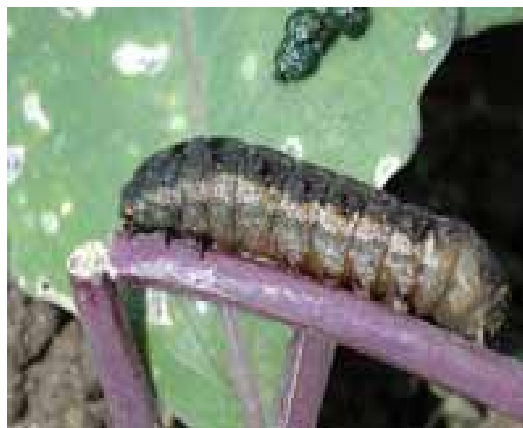
гамбусаки кирми тирамоҳӣ

Чораҳои мубориза: 1. Усулҳои пешгири ва агротехникӣ – Шудгори тирамоҳӣ дар чуқурии 38 – 40см; гузаронидани яҳоб; тоза намудани майдон ва атрофи он аз алафҳои бегона; обҷерӣ намудани киштзор. 2. Усули химиявӣ – истифодаи захрдоруҳо ба монанди Фостак 0,25л/га; Детис 0,6-0,7л/га. 3. Усули биологӣ: истифодаи Габробракон ва Трихограмма.