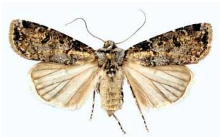
шабпараки кирми тирамоҳӣ

Кирми тирамоҳӣ – баргҳои навсабз ва ниҳолҳои пахтаро аз реша нобуд месозад. Баъди саросар зиёд шудани ҳашарот нуқтаи сабзиши ниҳолҳоро ҳам хоида нобуд месозад. Шабпараки модина дар танаи алафҳои бегона ба монанди печак, ширгов, шӯра ва дигрҳо то 2000 дона тухм мегузоранд. Кирминаҳо баъди 4 – 10 рӯз аз тухм мебароянд, рангашон хокистарии заминмонанд буда дарозиашон то 5см мерасад. Онҳо дар қабати хок пинҳон шуда пояи ниҳолро аз дохил ва ё аз сатҳи замин хоида нобуд месозанд. Кирмҳо шабона бисёр фаъол мешаванд. Барои инкишофи онҳо хокҳои нисбатан хушк мувофиқ мебошад. Зимистонро гамбӯсақҳо дар чуқурии 10 -30см хок мегузаронанд.