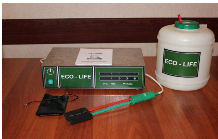
Рис. 1. Электролизная установка для получения электролитического гипохлорита натрия.

Слабощелочной раствор довольно устойчив. Дезинфицирующее действие ЭГХН основано на том, что при растворении в воде он точно так же, как хлор образует хлорноватистую кислоту, которая оказывает непосредственное окисляющее и дезинфицирующее действие. В воде ЭГХН постепенно разлагается. При этом происходит высвобождение свободного хлора и в воде образуются хлорноватистая и соляная кислоты по реакции: \text{NaClO} + \text{H}_2\text{O} = \text{HClO} + \text{NaOH} ; \text{HClO} = \text{ClO}^- + \text{H}^+ Реакция является равновесной, и образование хлорноватистой кислоты зависит от величины рН и температуры воды. В предлагаемом проекте ЭГХН получают на станции водоподготовки, в процессе электролиза раствора пищевой соли на электролизной установке «ЭКО-ЛАЙФ» (рис.1.). Электролизная установка состоит из бака концентрированного раствора соли (растворного бака), электролизной ванны (электролизёра), бака-накопителя раствора гипохлорита, выпрямителя и блока управления. Электролизёр непроточного типа представляет собой ванну с установленным в ней пакетом пластинчатых электродов.