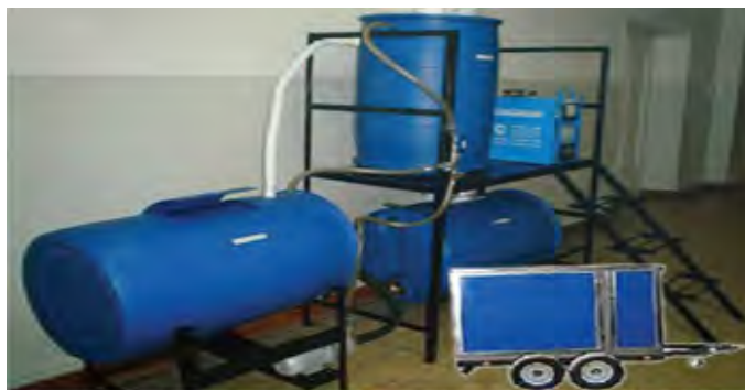
Внешний вид и вариант компоновки мобильной установки непроточного типа по получению гипохлорита натрия

Рисунок 2 Внешний вид и вариант компоновки мобильной установки