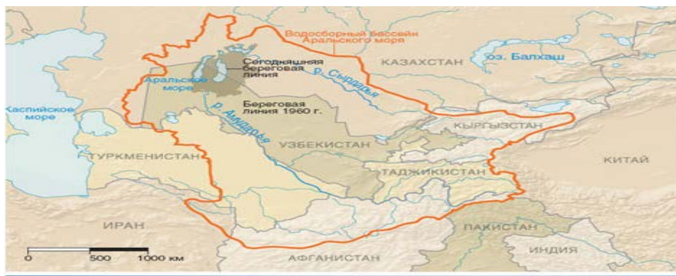
Рис. 2. Бассейн Аральского моря 27