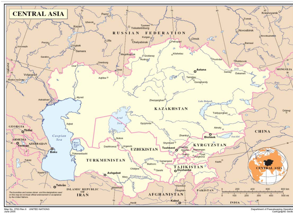
Рис. 1. Центральная Азия 26