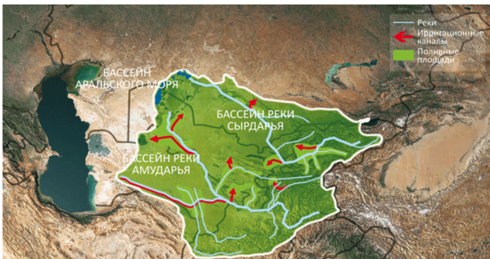
Рис. 4. Бассейн Аральского моря 29

Территории стран Центральной Азии в бассейне Аральского моря (БАМ), согласно нашим расчетам (и схеме выше), приведены в табл. 1 .