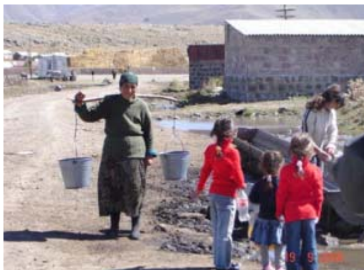
Picture 6.2. Rural water supply in Aparan District of Armenia