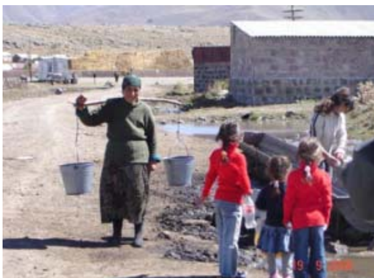
Рисунок 6.2. Пример водоснабжения сельской местности в Апаранском районе Армении