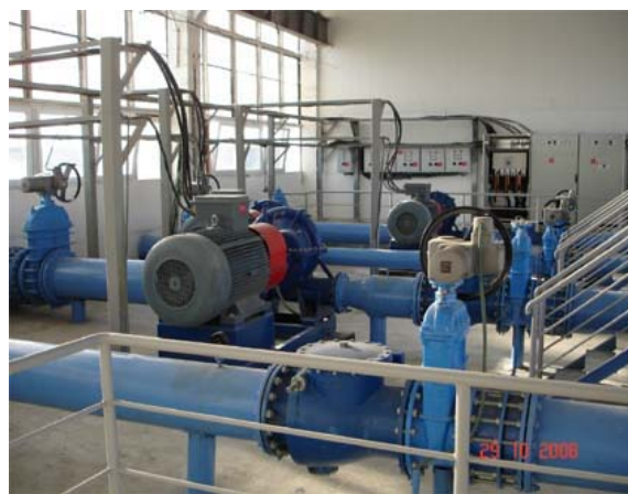
Рисунок 3.2. Арагатская насосная станция: до и после реконструкции

В Грузии охват системой централизованного водоотведения колеблется в среднем от 28,7% в малых населенных пунктах до 93,2% в крупных городах. Однако в некоторых городских населенных пунктах централизованный отвод стоков отсутствует. Системы водоотведения имеются в 45 городах Грузии, однако, состояние этих систем очень плохое. КОС построены в 33 городах. Эти станции запущены в эксплуатацию в период 1972-1986 годы. Ни одно из сооружений биологической очистки в настоящее время не функционирует. Механическая очистка стоков в некоторой степени эксплуатируются только на региональных КОС городов Тбилиси и Рустави, однако большинство сооружений практически полностью выведены из строя. В населенных пунктах, где очистные сооружения отсутствуют, сточные воды попадают непосредственно в поверхностные водные объекты. В последние годы в Грузии построена КОС для г. Сачхере с полной биологической очисткой.