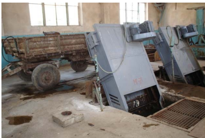
Picture 3.3. Debris filter of the treatment facilities in Fergana, Uzbekistan