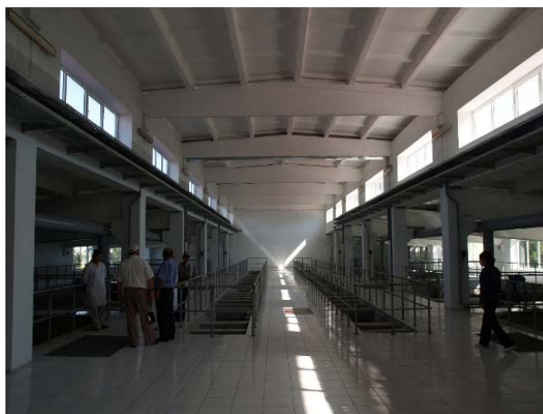
Picture 3.1. Newly constructed chlorination plant for drinking water in Azerbaijan

In Soviet period about 20 sewage treatment plants used to operate in Armenia, they used to cover the capital city of Yerevan, 25 other cities and towns and 55 rural settlements. Out of the number of existing STPs at present only the Yerevan Aeration Plant is operating, effectuating only mechanical treatment of some portion of the sewage. Starting from 2004 decisive steps have been taken in order to rehabilitate the sanitation and sewage treatment plants of Armenia.