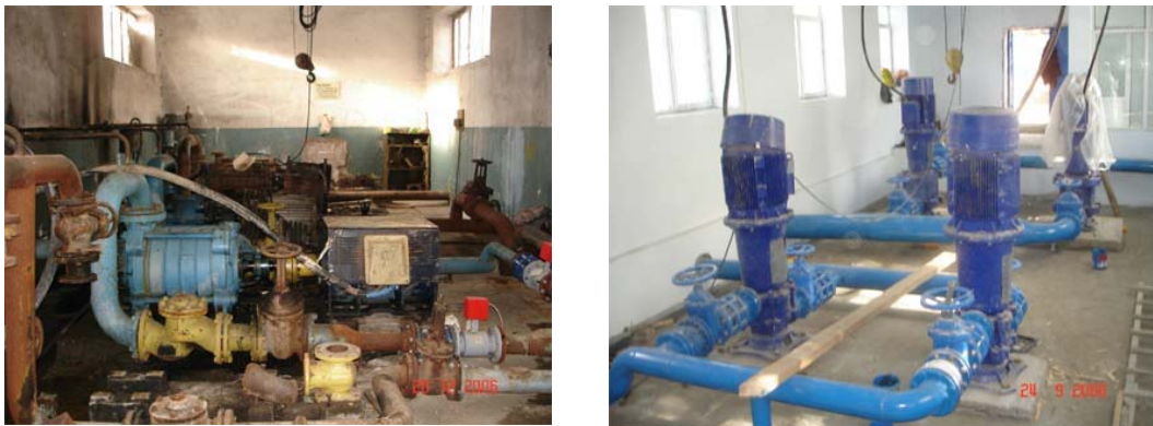
Picture 6.1. Aparan Pump Station in Armenia – prior and after reconstruction

The process of WSS transfer to private owners began in Georgia in 2008. That year the State has sold to the firm “Multiplex Energy Limited” the following entities: “Rustavivodokanal,” “Mtskhetavodokanal,” “Tbilisi Water” and “Gruzvodokanal,” the latter owns the regional treatment facilities in the cities of Tbilisi and Rustavi. According to the contract the Firm should modernize the existing water supply and sanitation systems and to improve the water supply in the cities of Rustavi, Tbilisi and Mtskheta.