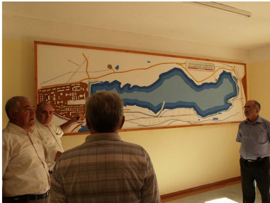
Picture 5.1. Azeri colleagues explain to GWP CACENA delegation their plans of reconstruction and development of the water supply system in the areas surrounding Baki at the expense of the state budget of Azerbaijan (2008)

Distribution of the WSS regulation functions among various ministries and state authorities that have different priorities does not facilitate achievement of the required level of functioning, operation and the overall and equal development of WSS systems. Institutional structures for regulation, management and development in many countries of the region still need reforms depending on the national policies and strategies in each of the regional states.