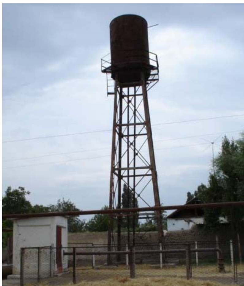
Рисунок 2.1. Водонапорная башня в сельской местности (Ферганская долина)

**) Водные ресурсы Казахстана в новом тысячелетии. Обзор ПРООН, 2004