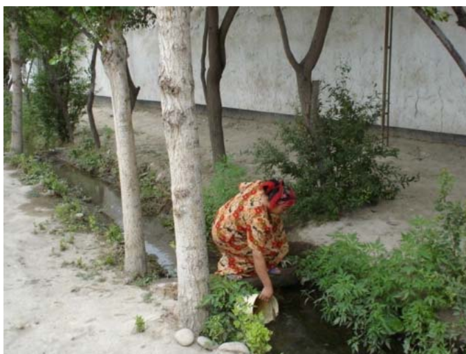
Picture 3.1. Over 40% of rural population in Fergana Valley use untreated water for household needs out of the wells and aryks (open ditches).

In Uzbekistan there are 265 cities, towns and settlements, 11.844 villages, including 903 in the hardly accessible small villages. In certain provinces of the country (Bukhara, Khorezm, Karakalpakstan) coverage of population with water supply systems is only 20-25 %. Water ducts and water supplying pipelines in the cities and settlements of the country are made out of the steel pipes. During the last 20-25 years of their operation, their wear-and-tear rate has reached 50%. Water pipelines are not being to their full capacity, thus water losses reach the rate of 40%. The oldest and the most developed system in Uzbekistan is the potable water supply system of the city of Tashkent. Water supply of Tashkent is being effectuated out of two sources: surface and underground located in the basin of Chirchik River.