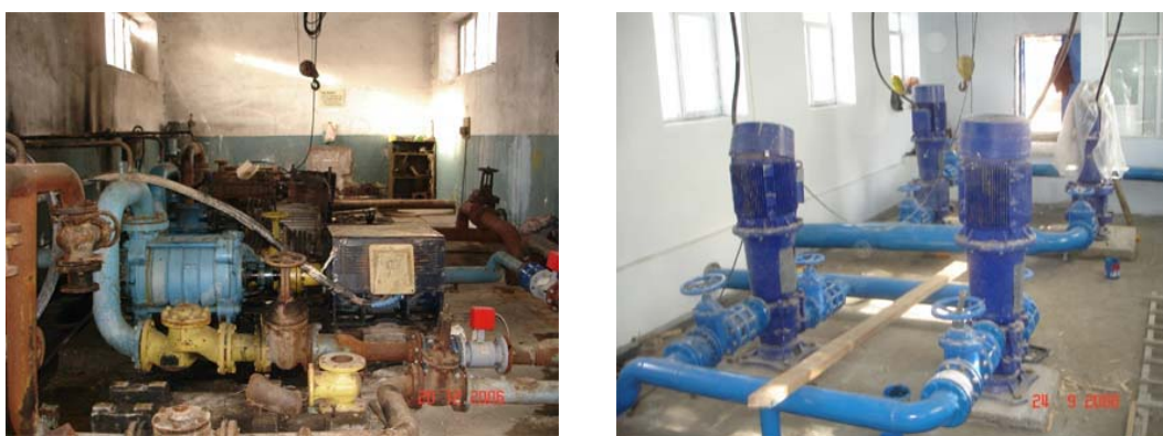
Рисунок 6.1. Апаранская насосная станция в Армении – до и после реконструкции

В 2008 году в Грузии начался процесс передачи ВКХ в частную собственность. В 2008 г. государством были проданы фирме “Multiplex Energy Limited” организации “Руставиводоканал”, “Мцхетаводоканал”, “Тбилисская вода” и “Грузводоканал”, на балансе которого находятся региональные очистные сооружения городов Тбилиси и Рустави. По договору Фирма должна модернизировать существующие системы водоснабжения и санитарии и улучшить водоподачу населению городов Рустави, Тбилиси и Мцхета.