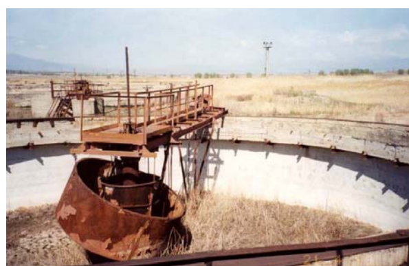
Picture. 3.4. Actual state of some of the treatment plants in the Southern Caucasian countries