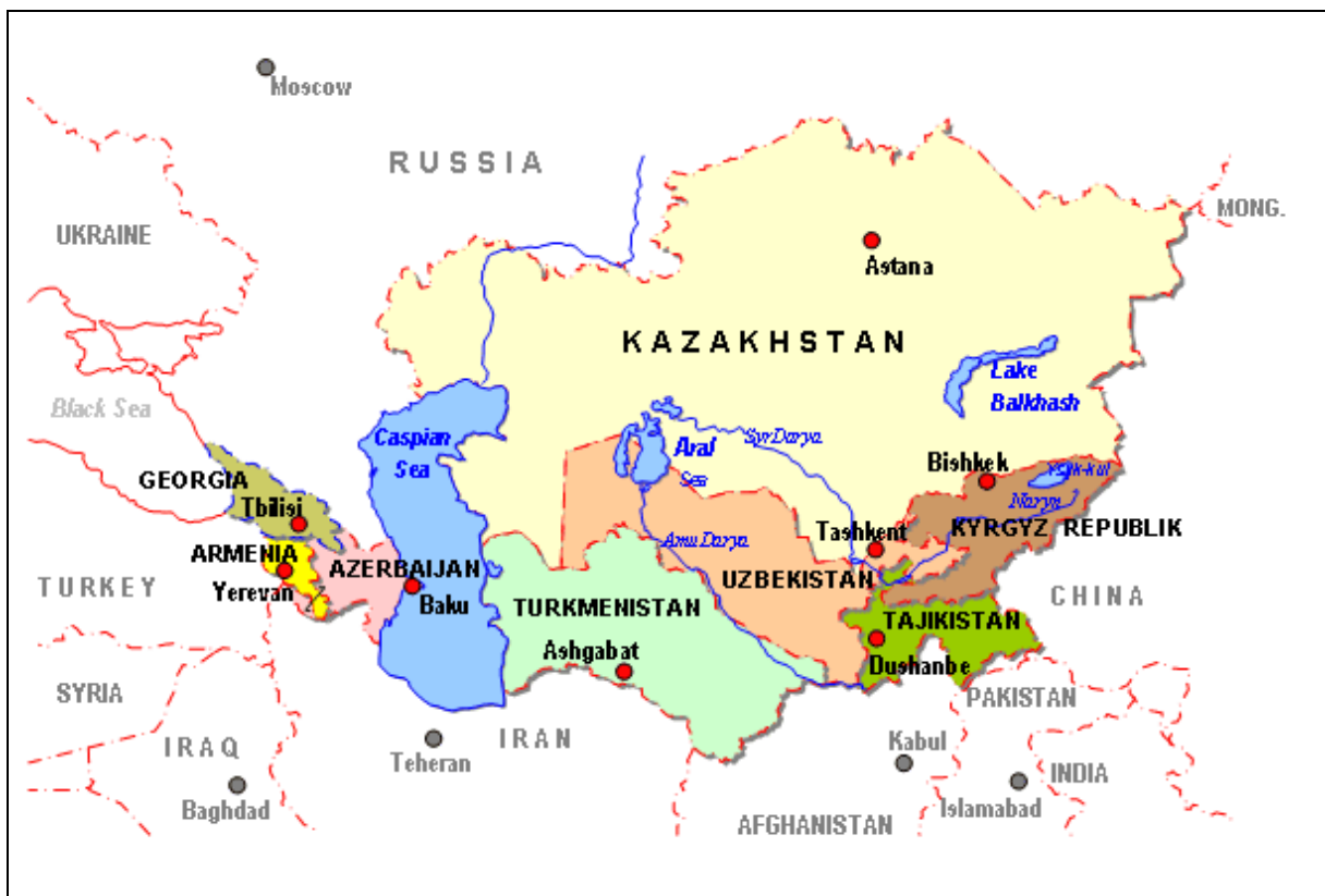
Picture 1.1. Geographical location

The Central Asian states (Kazakhstan, Kyrgyzstan, Tajikistan, Turkmenistan and Uzbekistan) are located in the center of the Eurasian Continent. Neighbors of those countries are Russia, China, Iran and Afghanistan. Western borders of Kazakhstan and Turkmenistan are being washed by the Caspian Sea. South-East borders of those countries stretch over the Tien Shan and Pamir Mountains. Republics of the Southern Caucasus (Azerbaijan, Armenia, and Georgia) are typical mountainous countries with a specific complex mountain terrain, which are situated to the south of the Caucasus Range between the Black Sea and the Caspian Sea. Southern borders of those states (Armenia, Azerbaijan) are being defined by Araks River. Countries of the Southern Caucasus have borders with Russia, Turkey and Iran (Figure 1.1).