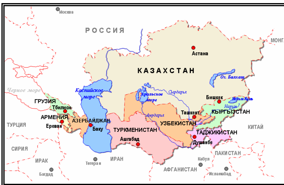
Рисунок 1.1. Географическое размещение стран региона

Страны Центральной Азии (Казахстан, Кыргызстан, Таджикистан, Туркменистан и Узбекистан) расположены в центре Евразийского материка. Внешними соседями этих стран являются Россия, Китай, Иран и Афганистан. Западные границы Казахстана и Туркменистана омывают воды Каспийского моря. Юго-восточные границы этих стран проходят через Тянь-Шаньские и Памирские горы. Республики Южного Кавказа (Азербайджан, Армения, Грузия) типично горные страны с характерным сложным рельефом и расположены южнее Кавказских гор между Черным и Каспийским морями. Южные границы стран (Армения, Азербайджан) определяются рекой Аракс. Страны Южного Кавказа граничат с Россией, Турцией и Ираном (Рис. 1.1).