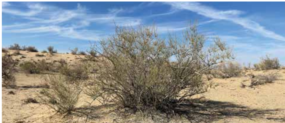
Рисунок 7: Растение «Кандым».

растений 3 , обитающих в условиях высокой солености, способных выживать в особо суровых условиях климата представителями псаммофильных растений 4 – растения подвижных песков с развитой корневой системой, обеспечивающей высокую выживаемость.