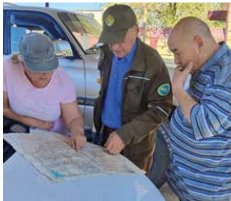
Рисунок 2: Определение маршрутов экспедиции.