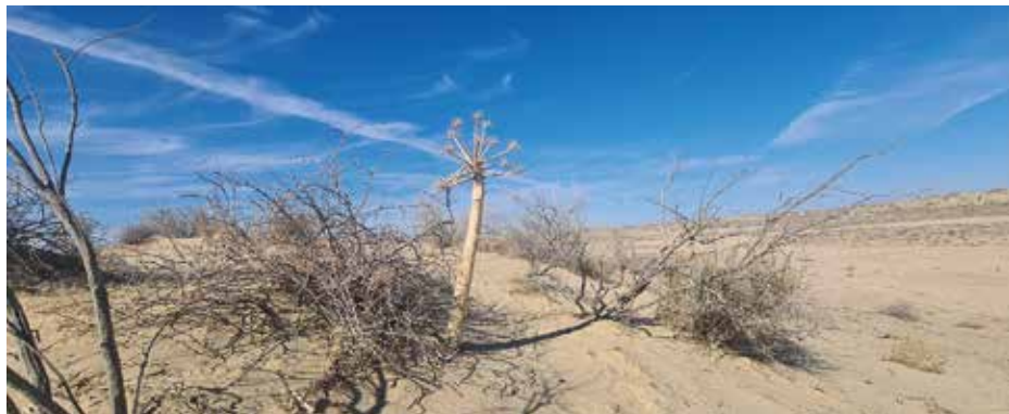
Рисунок 12: Закрепление барханов.

лесопосадочные работы с применением различных технологий, посадка механическим способом и аэропосевом. На северной местности и северо-востоке до границы с Казахстаном, вдоль русла Китайского (Южно-Каракалпакского коллектора) подвижные пески требуют закрепления.