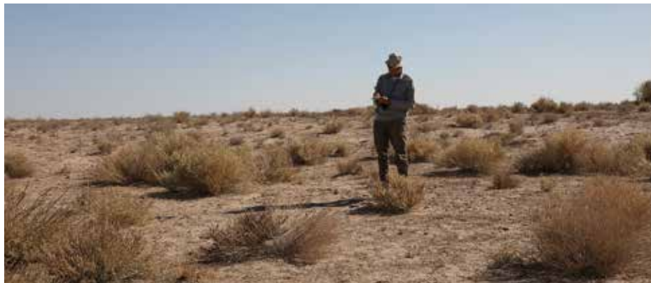
Рисунок 16: Изучение изменения ландшафтов на осушенном морском дне.

связана с тем, что при легком гранулометрическом составе 15 часто развитие почв заканчивается образованием эолового эрозионно-аккумулятивного рельефа.