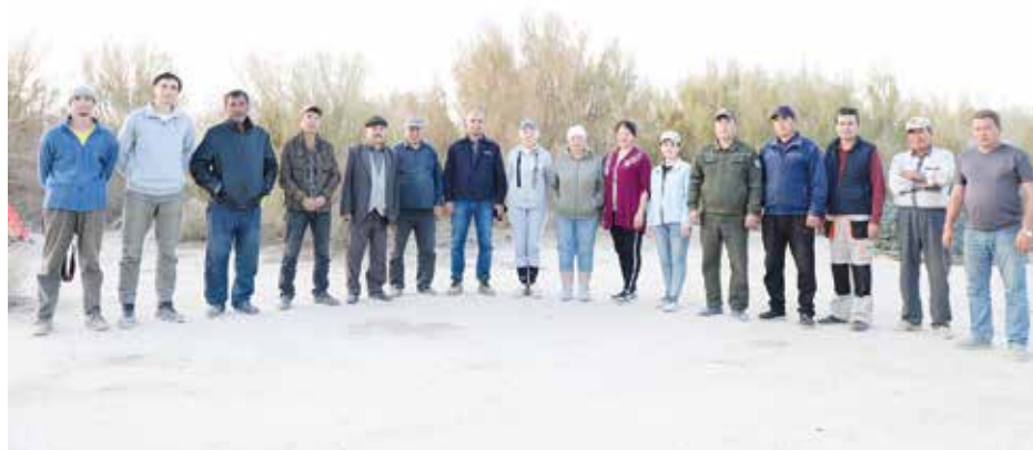
Рисунок 19: Команда 4-ой экспедиций (осень 2023 года).

отражающая реальную картину поверхности осушенного дна моря.