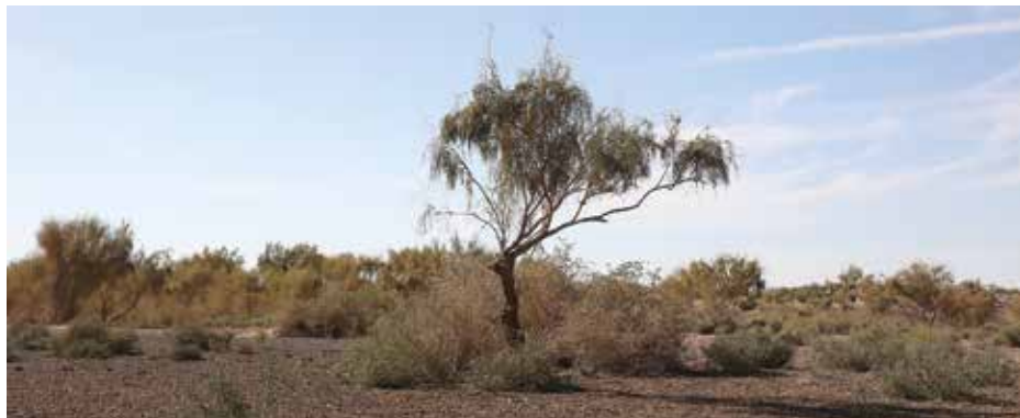
Рисунок 13: Черный саксаул.