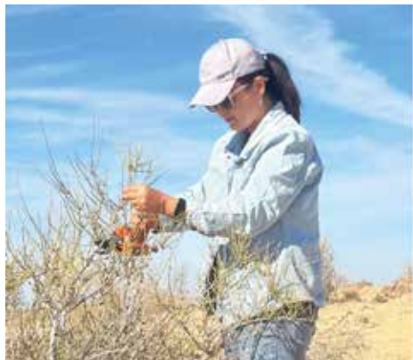
Рисунок 5: Сбор образцов пустынных растений.