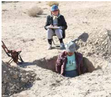
Рисунок 15: Изучение почвенного покрова.

горизонта, определены химические и физические свойства почв. Построена почвенная карта (ГИС).