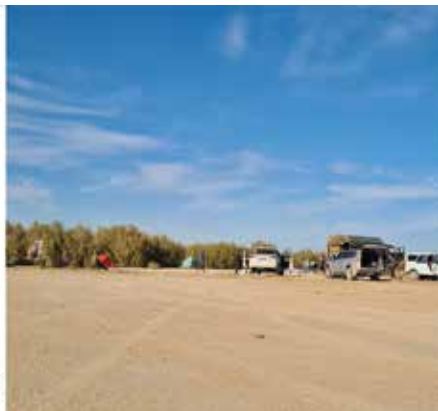
Рисунок 18: Лагерь экспедиции.

сообществ с исследованием древесно-кустарниковой растительности, изучение почвенного покрытия, дешифрование и картирование ландшафтов осушенного дна Аральского моря по данным космических снимков (дистанционного зондирования).