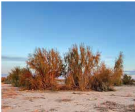
Рисунок 11: Растение «Саксаул».

Саксаул рядовой посадки в некоторых местах с применением мехзащиты. Состояние растений с разнотравьем хорошее, средняя высота 3,5-4 метра, средний диаметр 2-2,5 метр, между рядами имеется возобновление. Высота 1,5-2 метр, средний диаметр 0,8-1,2 метр, плотность 500-800 тыс. шт. на 1га.