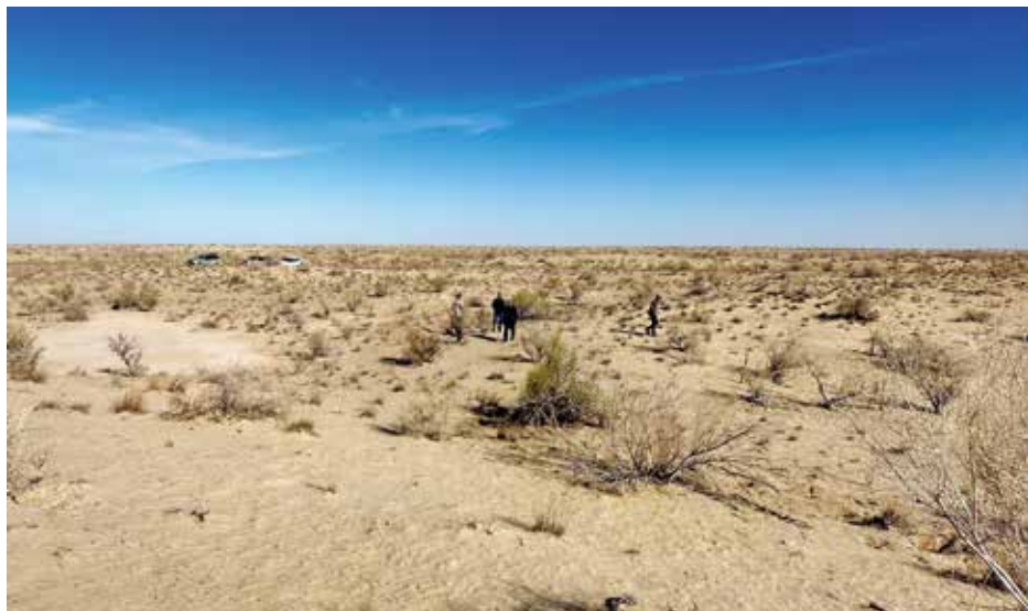
Рисунок 1: Обзор осушенного дна Аральского моря, 4- экспедиция.

Цель проекта – организация мониторинга для определения состояния дельты реки Амударья и осушенного дна Аральского моря с помощью космических наблюдений и наземных экспедиций для оценки изменения состояния моря