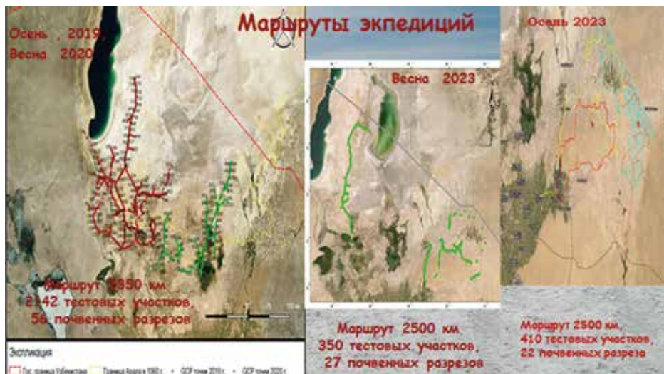
Рисунок 4: Карта маршрутов 4-х экспедиций.

Маршруты экспедиций определялись по космическим образам территории. Общая протяжённость маршрутов порядка 10 350 км., охвачено 2.7 млн. га территории, заложено 105 почвенных разрезов, проведено более 1.5 тыс. анализов почв и воды, обследовано 76 скважин и колодцев, проведено детальное описание 2 800 точек поверхности.