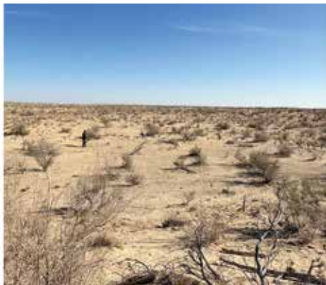
Рисунок 3: Осушенное дно Аральского моря.

и Приаралья по улучшению экологического состояния и эффективности использования подаваемой воды.