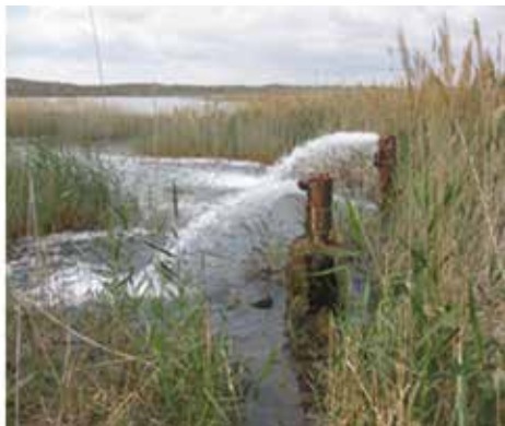
Рисунок 9: Самоизливающаяся скважина.