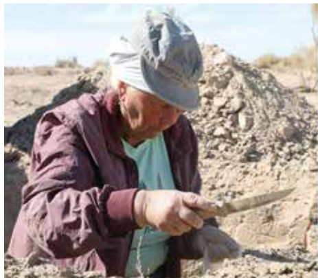
Рисунок 14: Процесс почвенных разрезов.