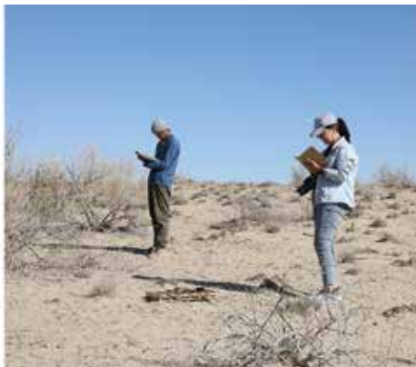
Рисунок 6: Определение изменения растительного покрова.