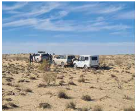
Рисунок 10: Остановка для описания территории.