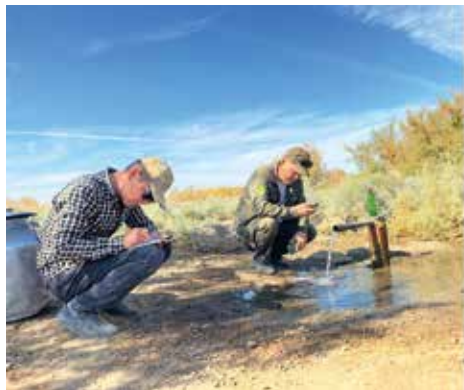
Рисунок 8: Измерение состояния подземных вод.