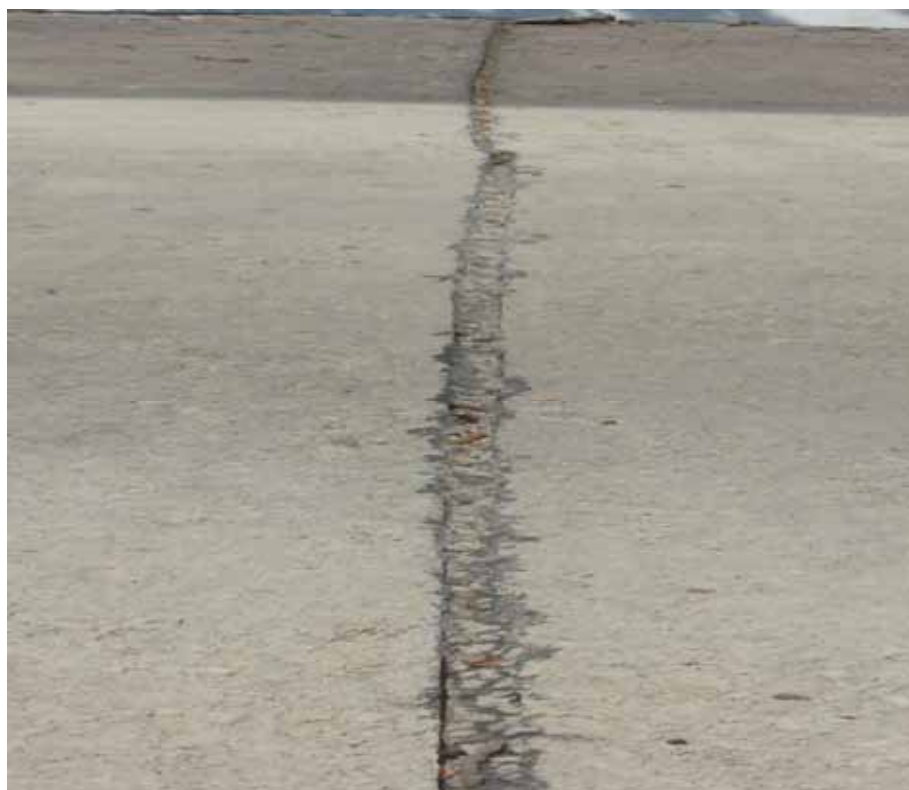
Прямой заливной шпатлевочный шов на основе БПК

Применяются в ремонтно-восстановительных работах бетонных облицовок гидротехнических сооружений.