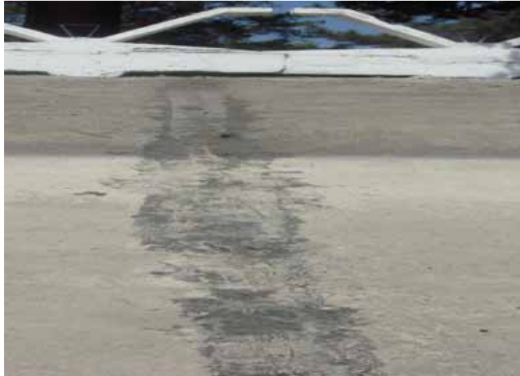
Оклеечный стык с заплечиками

Применяются в ремонтно-восстановительных работах бетонных облицовок гидротехнических сооружений/