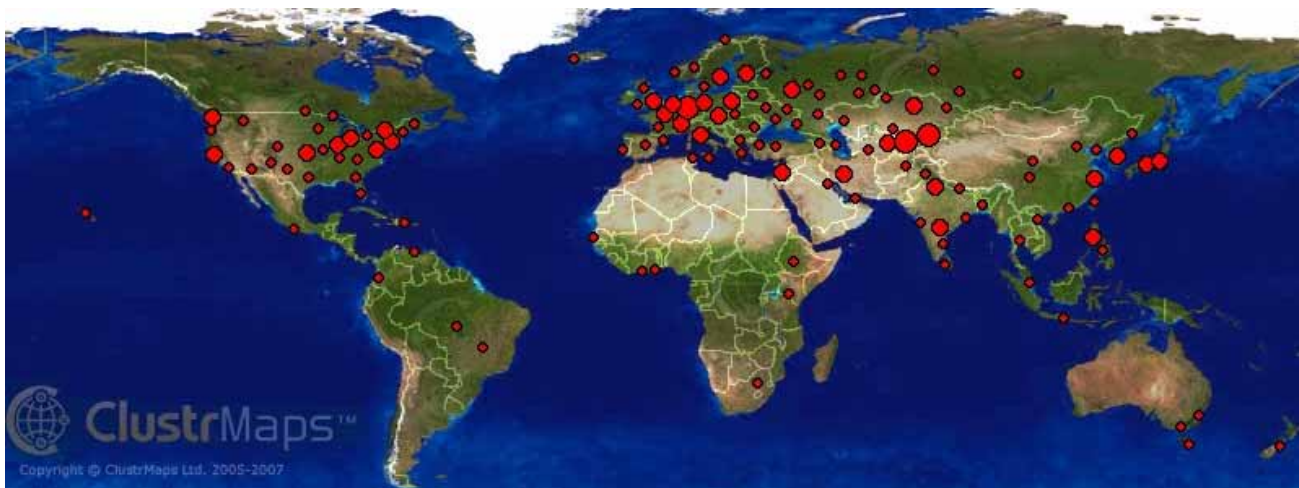
География посещений для домена icwc-aral.uz