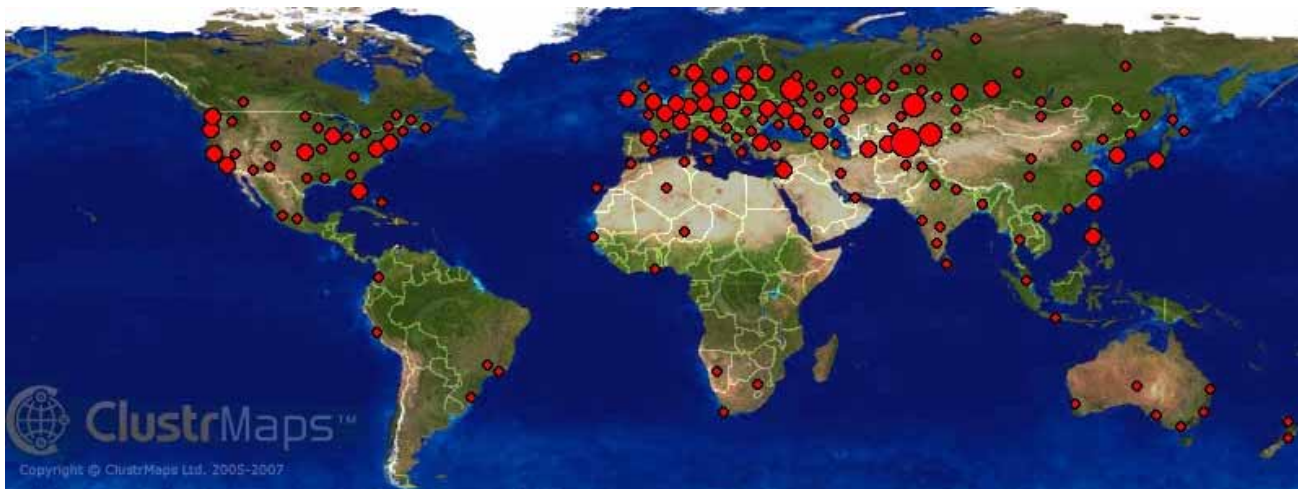
География посещений для домена sawater-info.net

На представленных ниже рисунках показана география посещений портала: