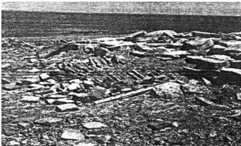
Рис. 1. Западный склон некрополя.

При предварительном визуальном обследовании памятника выяснилось, что всю его центральную часть образуют развалины прямоугольной постройки, основания стен которой сложены из каменных плит. Размеры постройки 24x10 м. Основания стен шириной 1,45-1,65 м. Плоские каменные плиты уложены так, что ровные края образуют плоскости. Прямоугольник постройки разделен двумя поперечными стенами на три помещения (№ 1, 2, 3 — нумерация с юга на север) (рис. 2). Многие каменные плиты сдвинуты со своих мест и находятся внутри помещений. Размеры наибольших плит 1,2x1,1 м; 1,0x1,4 м.