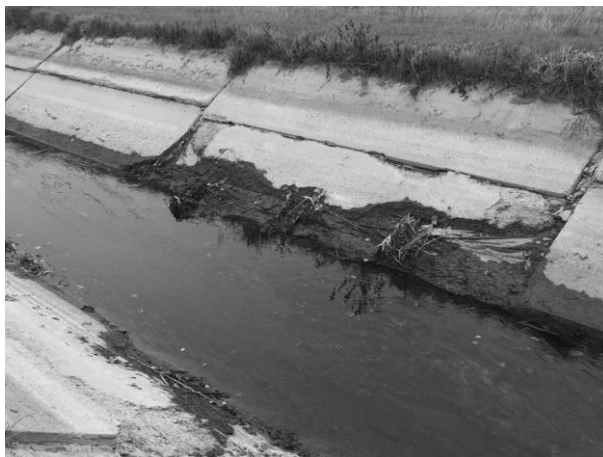
Рисунок 2 – Техническое состояние бетонной облицовки оросительного канала

тока, а на откосах разрушение бетонного защитного слоя с оголением арматуры и противодиффузионного элемента в виде пленки (рисунок 2).