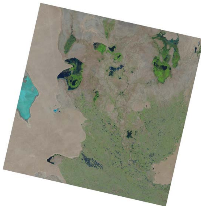
Рис. 2 Приаралье. На основе снимка Landsat 8, 25 мая 2020