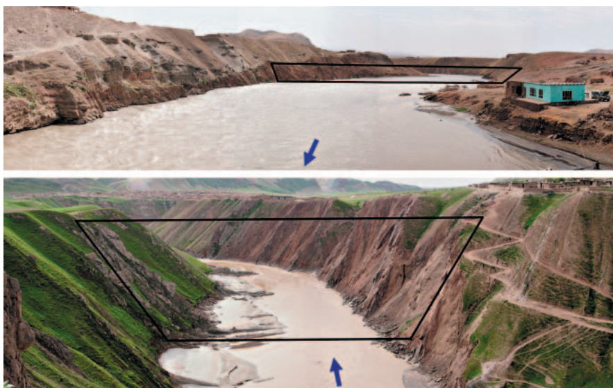
Рис. 2: Место возможного створа плотины: створ №1 (вверху), около 10 км вниз по течению от створа №2, вид со стороны НБ; створ №2 (внизу), вид со стороны ВБ

ных требований, актуализировать технические решения и рентабельность, приняв во внимание реалии сегодняшнего дня. Однако, оказалось, что требуется модификация обоснования проекта. Кроме того, Афганистан относится к наименее электрифицированным странам мира, в связи с чем имеется большой интерес к интеграции в новый проект возможности использования гидроэнергетических ресурсов.