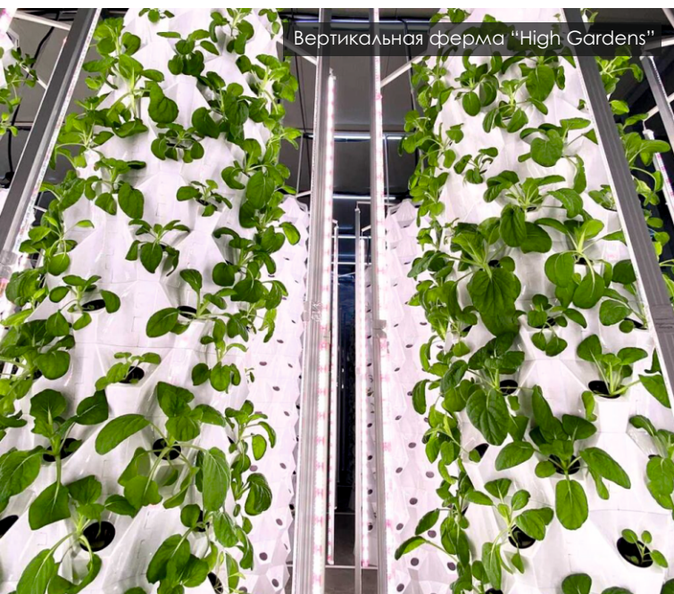
Вертикальная ферма "High Gardens"

В рамках государственной программы «Поддержка владельцев земель сельскохозяйственного назначения» с 10 мая оказывалась поддержка малым землевладельцам. Программа предусматривала выдачу специальных агрокарт, на которые фермерам, легально владеющим зарегистрированными земельными участками площадью от 0,25 до 1,25 га, начислялись агробаллы. На них фермеры могли приобрести удобрения и препараты для защиты растений, семена или саженцы, сельскохозяйственные инструменты и т.д.