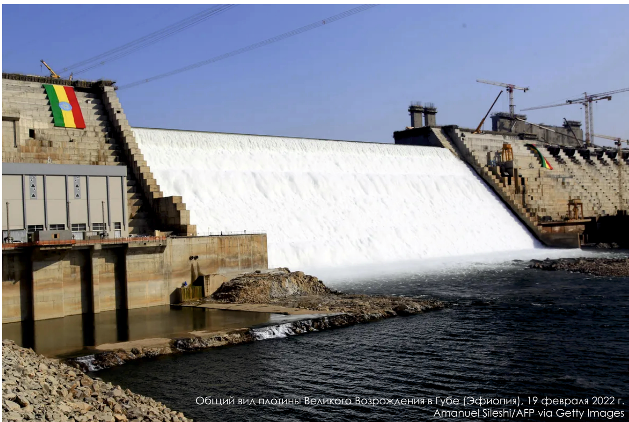
Общий вид плотины Великого Возрождения в Губе (Эфиопия), 19 февраля 2022 г.

Египет обвиняет Эфиопию в нарушении международного права – несогласованном с ним и Суданом заполнении водохранилища плотины. Египет также призвал Совбез вмешаться, чтобы усадить Эфиопию за стол переговоров. Огромная плотина стоимостью $4,2 млрд находится в центре регионального спора с момента начала ее строительства в 2011 г. В середине июня Эфиопия объявила о выполнении строительных работ на 88%. Строительство ГЭС Великого Возрождения планируется завершить к концу 2023 г.