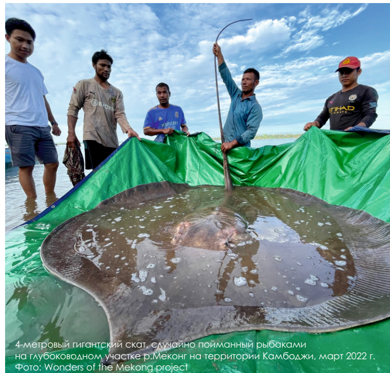
4-метровый гигантский скат, случайно пойманный рыбаками на глубоководном участке р. Меконг на территории Камбоджи, март 2022 г.

Подводная экспедиция подтвердила присутствие крупнейших и находящихся под угрозой исчезновения пресноводных рыб на отдаленном и малоизученном участке р. Меконг на северо-востоке Камбоджи. Среди находок – 180-килограммовый гигантский пресноводный скат . На этом участке также обитают гигантские меконгские сомы и гигантские барбусы ( Catlocarpio siamensis ), занесенные в Красный список МСОП.