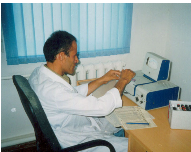
Фото 3. Работа на КФК-2.