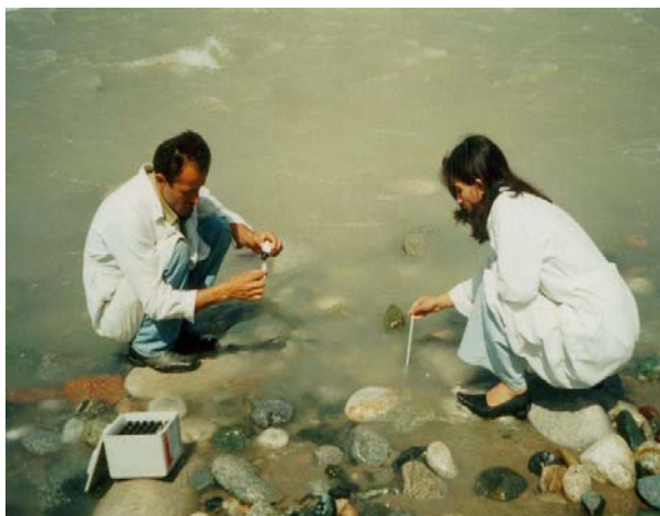
Фото 5. Определение температуры и растворенного кислорода (анализ 1-го дня).