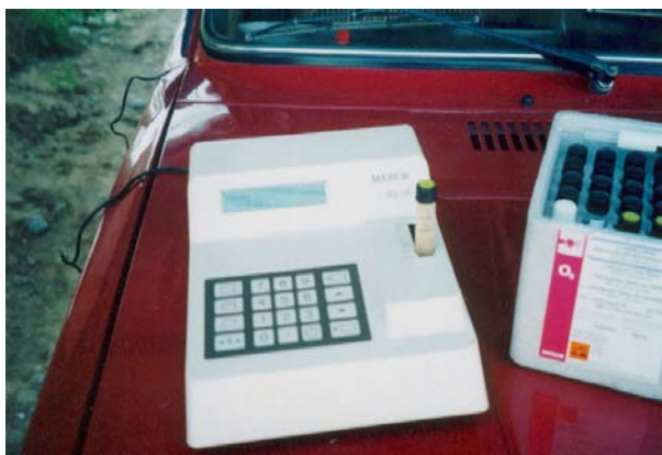
Фото 4. Анализ первого дня (у реки).

В случае неустойчивости ряда ингредиентов определение их производят непосредственно у объекта в свежееотобранных пробах (анализ 1-го дня). Анализ включает определение: температуры ( t^{\circ} ), запах, двуокись углерода ( \text{CO}_2 ), растворенный кислород ( \text{O}_2 ) и БПК 5 (биохимическое потребление кислорода) – фото 4, 5.