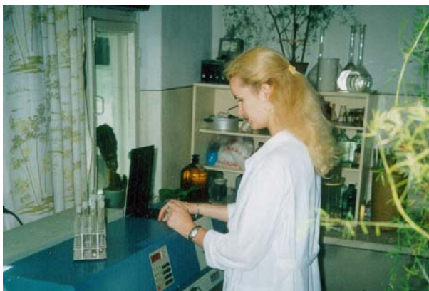
Фото 2. Спектрофотометрический анализ.

Широко распространенным химическим загрязнителем являются пестициды. Список загрязняющих веществ, для которых утверждены предельно допустимые концентрации (ПДК), составляет 650 наименований, но список периодически дополняется. В анализе используется серия фотометрических и спектрофотометрических методов (фото 2, 3).