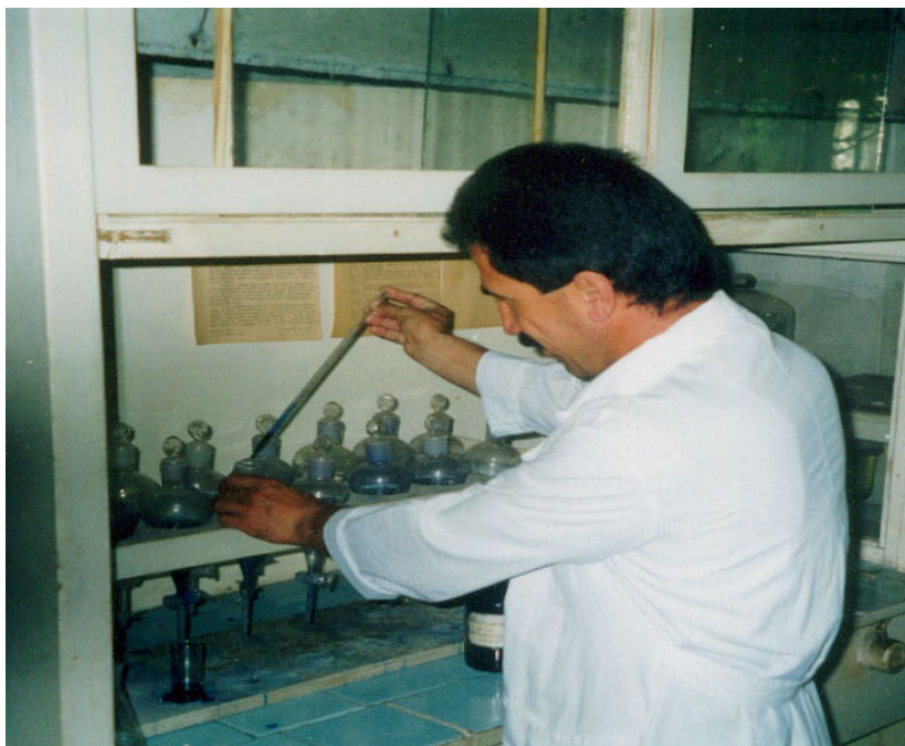
Фото 1. Определение СПАВ.

Химический состав воды характеризуется большим числом ингредиентов: газовый состав (4 показателя), главные ионы (6 показателей), органические вещества (7 показателей), биогенные компоненты и загрязняющие вещества неорганического происхождения (более 13 показателей). Самый распространенный загрязнитель водоемов – СПАВ – синтетически поверхностно активные вещества. Уже при небольших его концентрациях прекращается рост водорослей и другой растительности (фото 1).