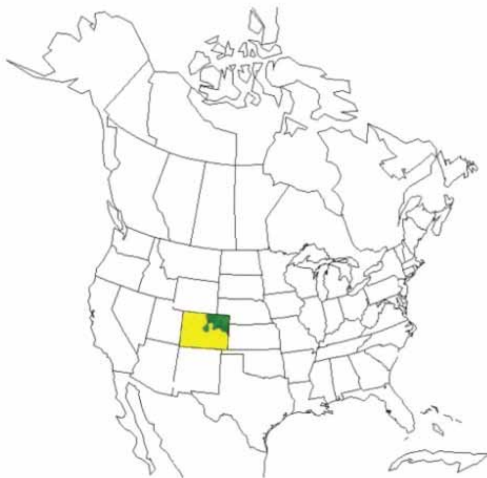
Рис. 1. Бассейн реки Саут-Платт, Колорадо, запад США

имеют права, таким образом, который предотвращает постоянную продажу воды. К таким методам относятся соглашения на водоснабжение, допускающие перерывы в подаче воды, переменное парование, банки воды и сокращение безвозвратного водопотребления за счет изменения практики орошения и агротехники.