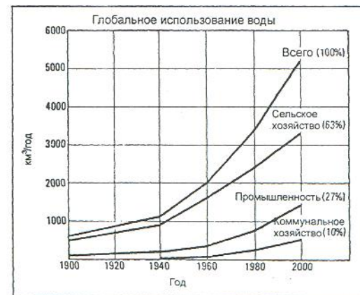
Рис. 3 Потребление воды в соответствии с использованием

Более 70 % всей потребляемой воды идет на орошение, которое обеспечивает треть всего продовольствия. Но водоподача на орошение растет гораздо медленнее, чем потребление воды в городах и промышленности. Потребление промышленностью в 2000 г. возрастет с 22 до 27 % по сравнению с 1980 г., а коммунальными службами с 7 до 10 %; сельхозпотребление снизится с 71 до 63 % (рис. 3).