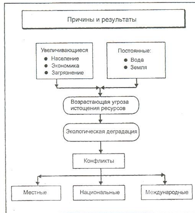
Рис. 4 Эффект роста населения ставит повышенные требования перед конечными водными ресурсами

Влияние человеческой активности на собственное будущее выражено в виде диаграммы проф. Яном Лундквистом, Швеция. Возрастающее население, развивающаяся экономика и растущее загрязнение ставят большие требования перед конечными водными и земельными ресурсами (рис. 4). Эти требования ведут к деградации окружающей среды и конфликтам локального, национального и международного масштабов, таким, как развитие и управление водными ресурсами в бассейнах рек.