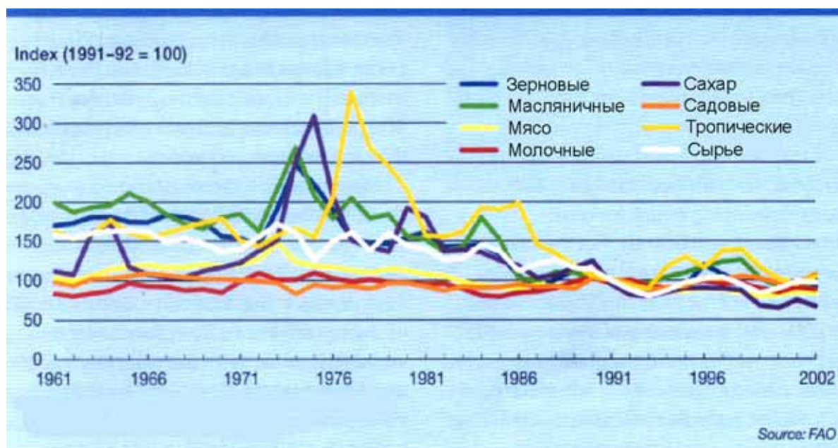
Рис. 1 Изменение цен на сельхозпродукцию, 1961-2002

Как видно из рис. 1, цены на зерно за прошедшие 15 лет снизились вдвое, на хлопок – в 1,5 раза, на рис более, чем в два раза. Это привело к резкому уменьшению доходности орошаемых земель в регионе. Данные программы ВУФМАС и А-2 Всемирного банка, приведенные в таблице 1, показывают, что средняя доходность орошаемых земель в 300 ... 980 долларов на 1 га в 1993...1995 гг. снизилась до 150...580 долларов на 1 га в 2002 г.