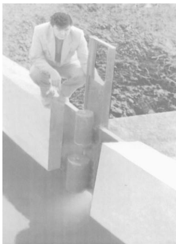
Рис. 2. Внедрение субиригации на коллекторах Акрабад Камашинского района