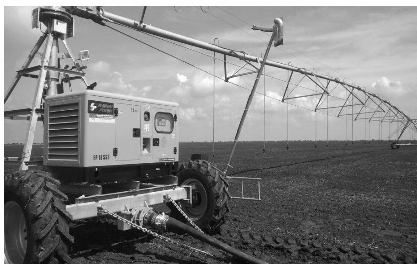
Рисунок 3 – Фото конструкции главной ходовой тележки многоопорной дождевальная машины «Фрегат» [5]

Материалы и методы. Анализируемую базу для конструкторских расчетов составили различные методики и методы вычисления объемов произвольных пространственных фигур таких ученых, как Демокрит, Евдокс, Архимед, Кеплер, Кавальери, Ферма и др.