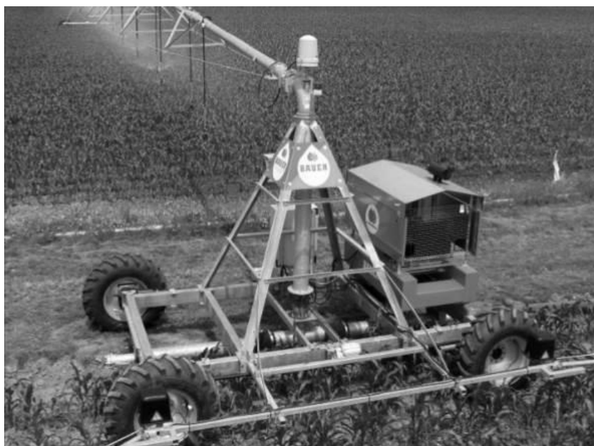
Рисунок 1 – Фото конструкции главной ходовой тележки многоопорной дождевальной машины Bauer [3]

Данная рамная конструкция главной ходовой тележки соответствует конструкциям большинства фронтальных тележек многоопорных дождевальных машин таких производителей, как Bauer, ГК «ТРИА», «Фрегат» и т. д., внешний вид которых приведен на рисунках 1–3 [3–5].