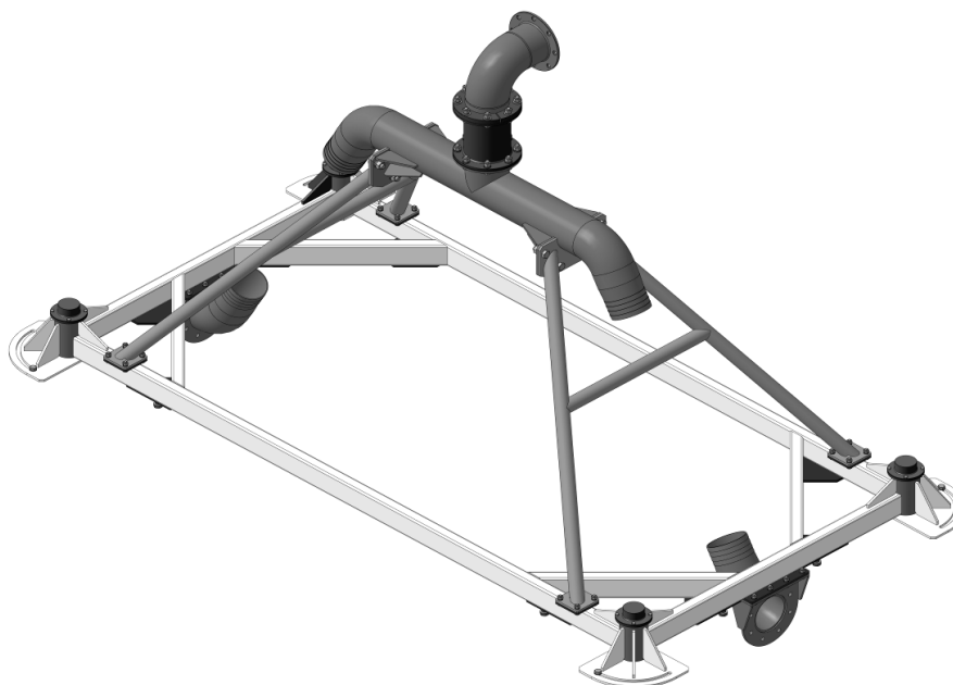
Рисунок 5 – Разработанная конструктивная схема главной ходовой тележки многоопорной дождевальной машины

Для реализации возможности размещения и транспортировки габаритного оборудования на главной тележке многоопорной дождевальной машины, работающей «в движении», и увеличения полезного монтажного объема без изменения размеров рамной конструкции необходимо объединить функции подводящего трубопровода и силового каркаса в единый узел. В связи с этим в ФГБНУ «РосНИИПМ» была разработана конструктивная схема главной ходовой тележки, представленная на рисунке 5.