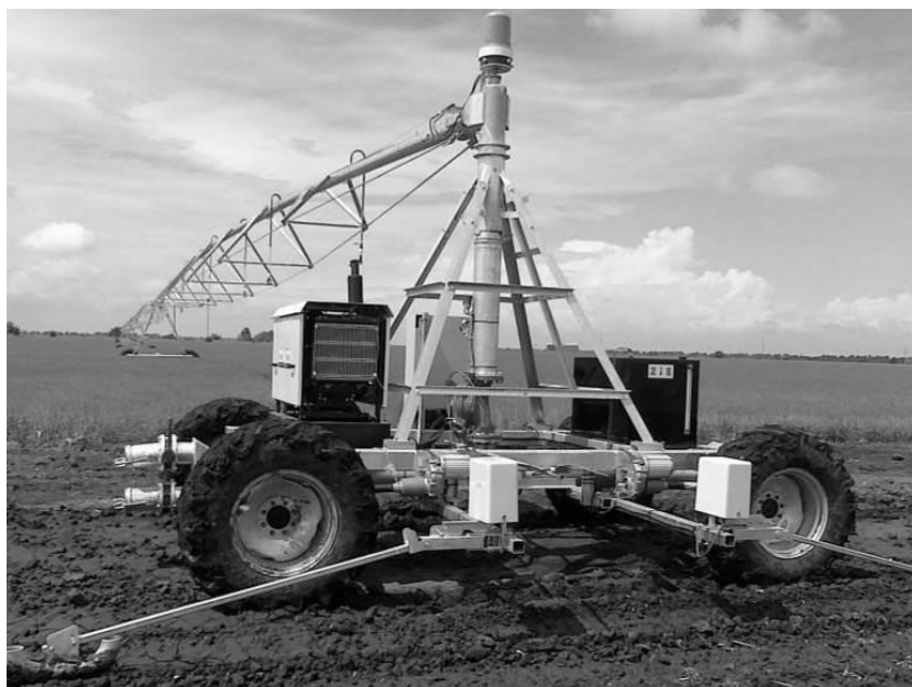
Рисунок 2 – Фото конструкции главной ходовой тележки многоопорной дождевальная машины 2iE [4]