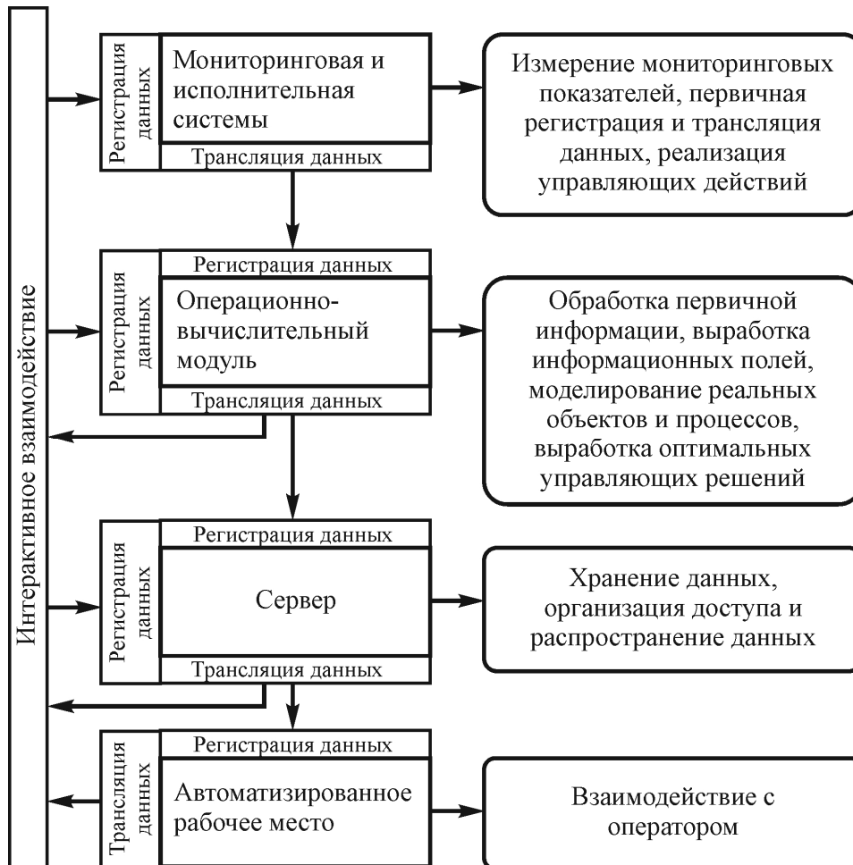
Рисунок 1 – Информационная система мониторинга и управления орошением с серверной схемой организации обмена информацией

Функция интеллектуального автоматизированного управления позиционируется качественной характеристикой гидромелиоративных систем нового поколения [8]. Этот уровень развития техники и технологий предполагает исключение человека из операционного процесса, с участием на более высоких управляющих уровнях. Наряду с совершенствованием алгоритмов стратегического и среднесрочного планирования, гидромелиоративные системы нового поколения предполагают качественное усиление функции контроля и управления орошением в режиме реального времени. Специфика систем реального времени требует решения целого комплекса задач, важнейшей из которых является оптимальная организация контролирующих и исполнительных функциональных модулей [2-3].