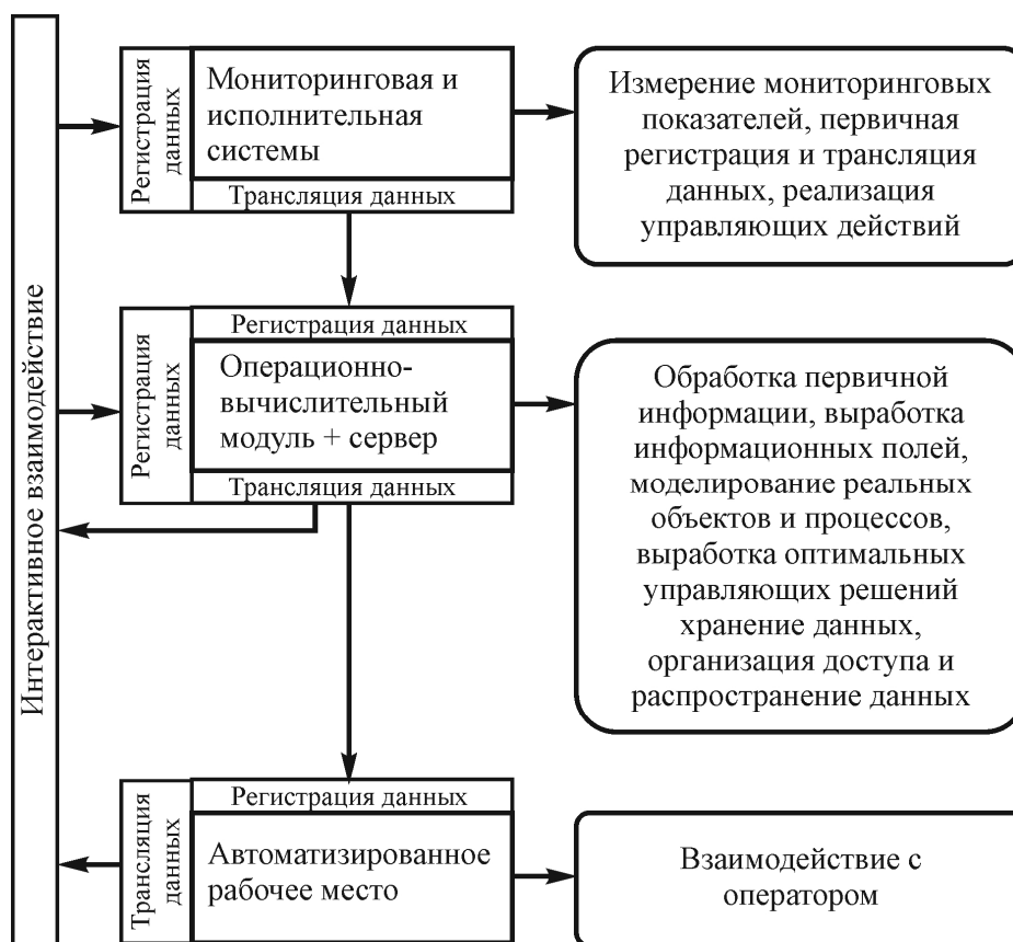
Рисунок 4 – Информационная система мониторинга и управления орошением с модульным объединением операционно-вычислительного центра и сервера

Серверная информационная система с объединенными функциями сервера и операционно-вычислительного модуля позволяет обойтись организацией двух каналов передачи данных в прямом направлении и еще двух, – для организации интерактивного взаимодействия. При этом сохраняется полный функционал классической серверной информационной системы.