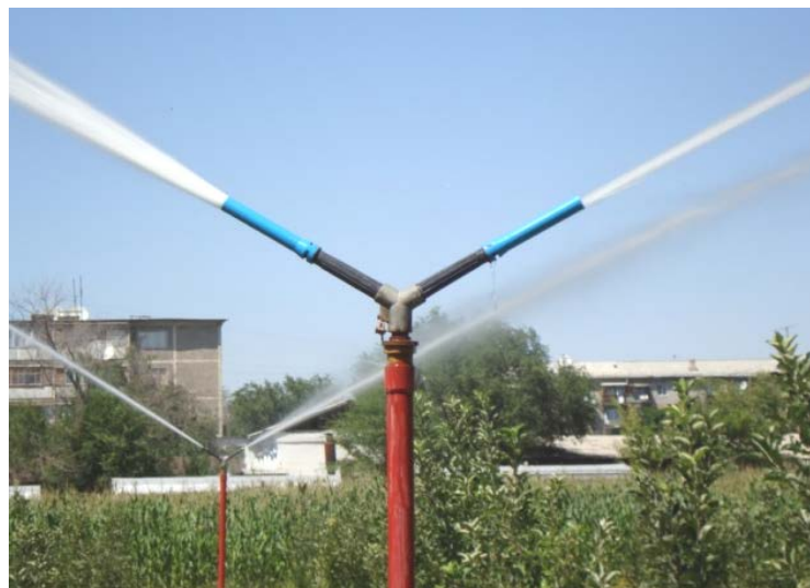
Рисунок 2 - Насадка специальная:

1 – камера специальная; 2 – крышка, 3 – ствол; 4 – сопло