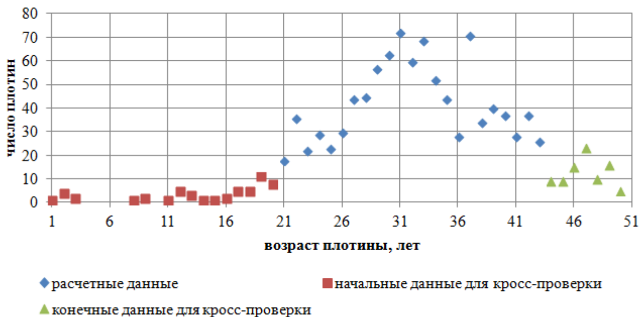
Рисунок 1 - Распределение возраста обследованных плотин

Следующим этапом стал поиск методов анализа полученной информации [6]. В рассмотрение были включены только гидроузлы, не имеющие собственника или службы эксплуатации и относящиеся к IV классу. Сформирована выборка, включающая сведения по 1018 грунтовым плотинам, возраст которых не превышал нормативный срок эксплуатации – 50 лет. Объем водохранилищ, создаваемых плотинами, в среднем составлял 0,14 млн. м 3 . Среднее значение максимальной высоты плотины в русловой части составляло 5,8 метров, при этом высоту до 10 метров имели подавляющее большинство плотин (94%). Гидроузлы использовались для сельскохозяйственных и технических нужд, пожаротушения, рекреации. Уровень безопасности плотин распределился следующим образом: 8,7% плотин имели нормальный уровень безопасности, 46,3% – пониженный, 28,7% – неудовлетворительный и 16,3% опасный уровень безопасности. Для возможности дальнейшей кросс-проверки полученных прогнозных зависимостей в расчете были использованы данные по 861 сооружению, остальные 157 (15%) в дальнейшем только сопоставлялись с прогнозными кривыми. Распределение возраста обследованных плотин приведено на рисунке 1.