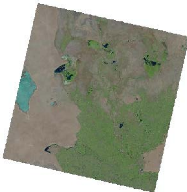
Рис. 2 Приаралье. На основе снимка Landsat 8, 14 сентября 2020