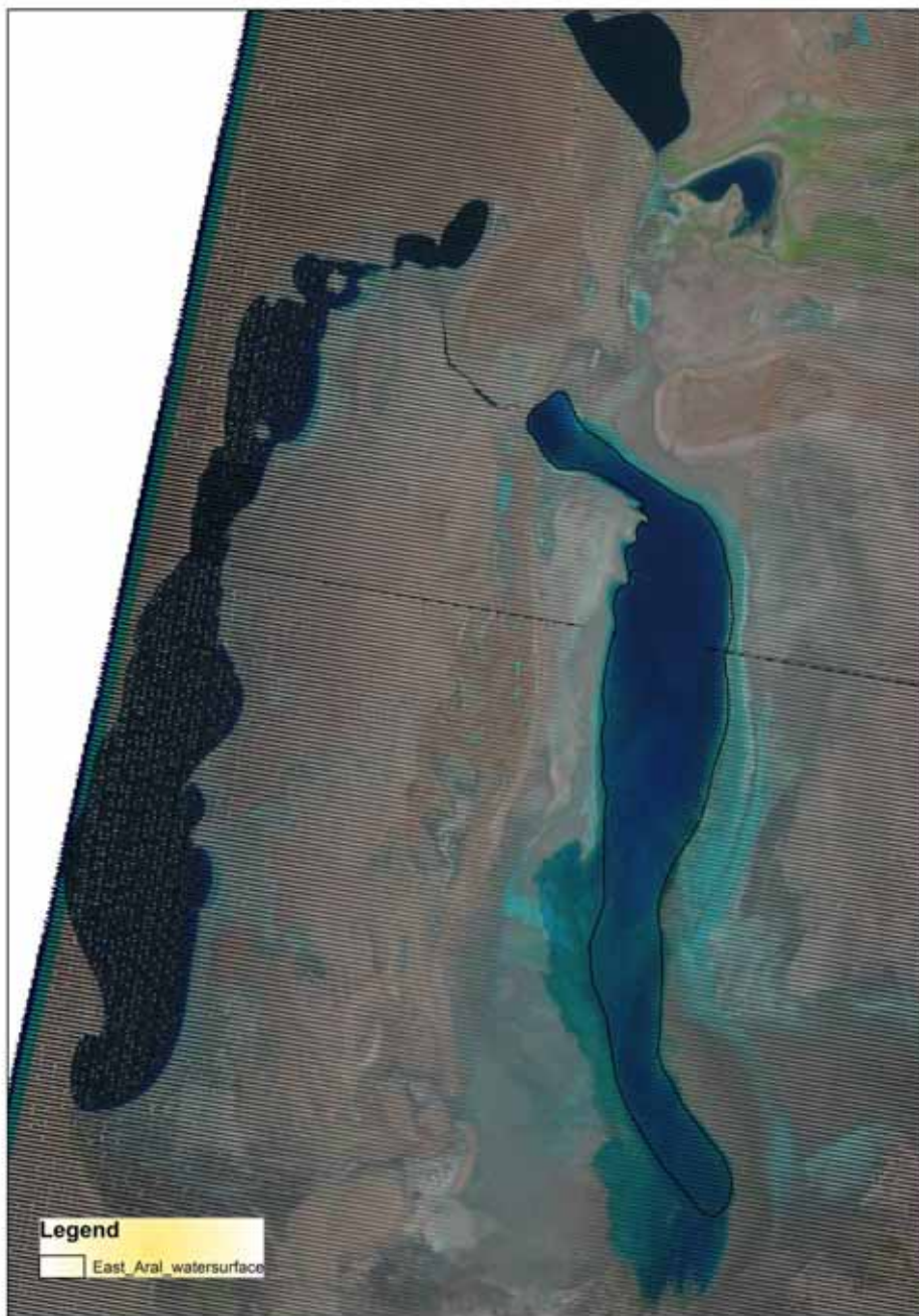
Рис.1 Снимок Аральского моря за 9 сентября 1

В НИЦ МКВК выполнен мониторинг Аральского моря и Приаралья с использованием спутниковых снимков Landsat 7. Снимки были получены 1 и 9 сентября 2015 года для Приаралья и Аральского моря соответственно. По ним определены площади ветландов и открытой водной поверхности на территории Приаралья и Аральского моря.