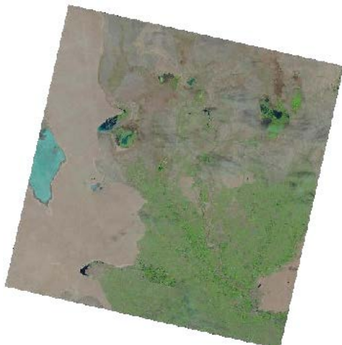
Рис. 2 Приаралье. На основе снимка Landsat 8, 31 июля 2021